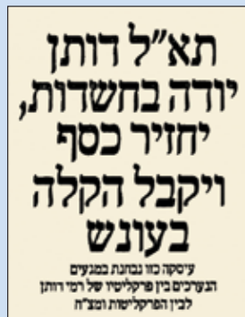
מתוך כתבה בעיתון מעריב, 12 בדצמבר 1990

מ/1/91 התובע הצבאי הראשי נ' תא"ל דותן; פסק הדין ניתן ביום 27 במרץ 1991; אב"ד: תא"ל פלד; שופטים: תא"ל מופז, תא"ל עמרם