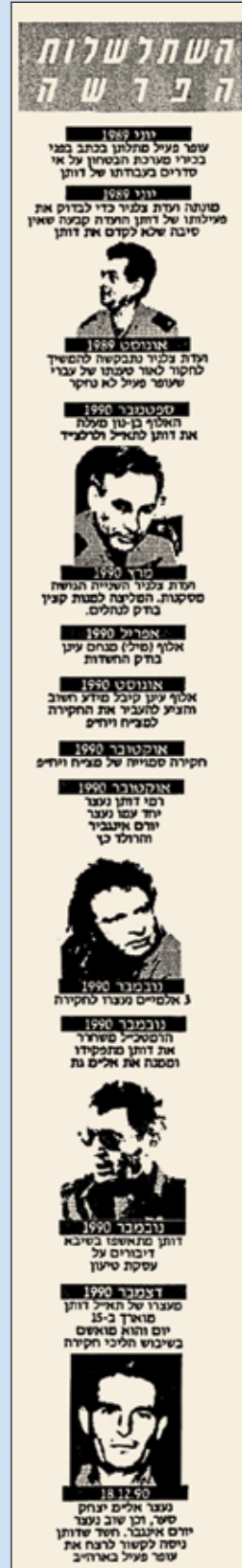
מתוך כתבה בעיתון מעריב, 20 בדצמבר 1990