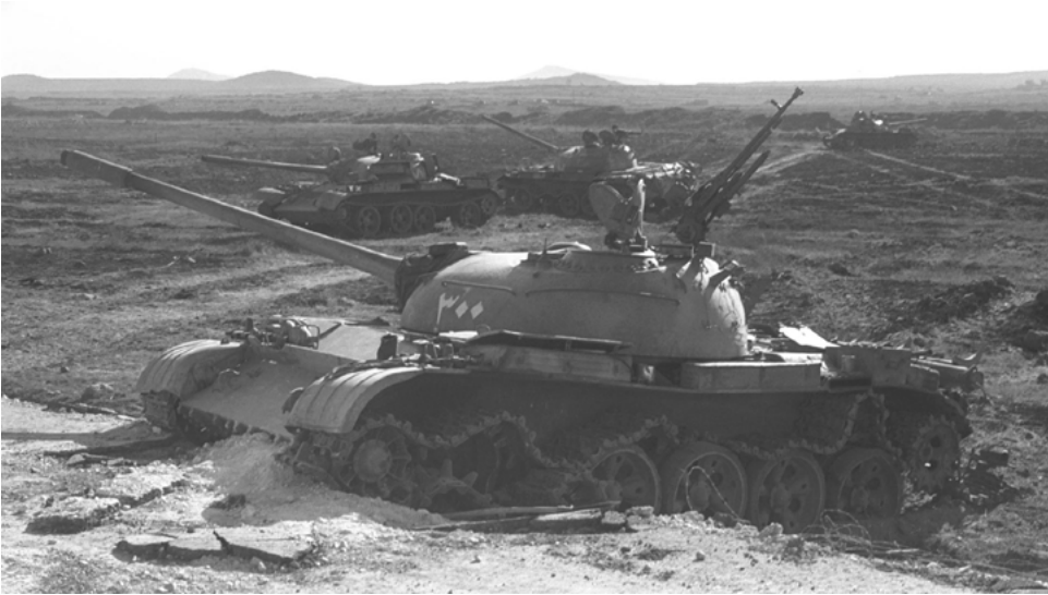
מורדות תל שער, טנקי טי 54/5 פגועים מחיל המשלוח העיראקי. באופק תלילי ענטר (צלם: אזורי מנשה; באדיבות לשכת העיתונות הממשלתית).

"משרת האימפריאליזם האמריקאי"; הפלישה לאיראן של ח'ומייני, אף שהאיתוללה הזדהה לחלוטין עם העניין הפלסטיני; כיבוש כוויית, אף שגם היא תמכה בעניין הפלסטיני ולא איימה ישירות על עיראק - את כל אלה ניתן וצריך להסביר כמסקנות שאליהן הגיע צדאם חוסיין בעקבות מלחמת יום הכיפורים. גם הפיתוח הגרעיני, שעד 1974 התנהל בעצלתיים, קשור למסקנתו שעד שתוכל עיראק להנהיג את הערבים כמעצמה גרעינית, עליה להתנהל כאילו היא ניצבת לבדה.