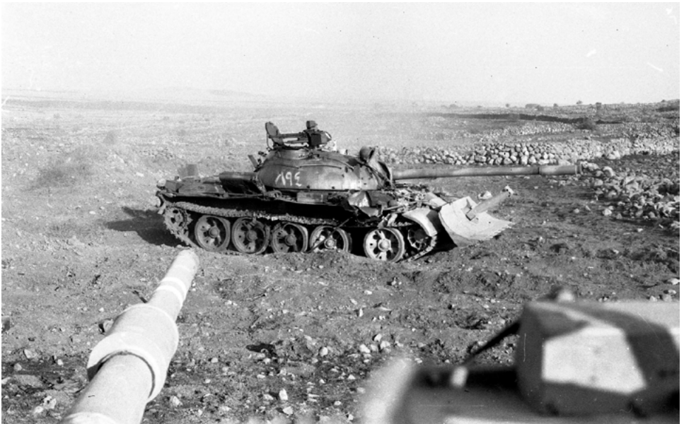
טנק דחפור מסוג ט-54 מכוח המשלוח העיראקי בשטח סוריה (באדיבות חטיבה 7).

החריגה של צדאם חוסיין וההנהגה העיראקית כולה באוקטובר 1973 מהעדפת האינטרסים המקומיים של עיראק למחויבות פאן-ערבית הפתיעה את ישראל לחלוטין. משמעות החריגה הקצרה הזו הייתה שלפתע, ב-12 באוקטובר, מצאה עצמה אוגדת דן לנר, שהייתה עייפה ו"קצרה" בדלק ותחמושת, כשהיא ניצבת בפני חטיבת החוד, חטיבה 12, של הדיוויזיה העיראקית המשורינת השלישית המסתערת עליה היישר מן המובילים הכבדים שמהם ירדו הטנקים. חטיבה 12 כונתה כוח חי'אלד בן אלוליד על שם המצביא הנערץ על צדאם חוסיין, שהנהיג את צבאות האסלאם המוקדם. הדיוויזיה השלישית הייתה דיוויזיית הדגל של עיראק. בעקבותיה הגיעה דיוויזיה משורינת נוספת, השישית, ובסך הכול נשלחו כ-700 טנקים. נשלחו גם כוחות גדולים נוספים בסדר גודל של דיוויזיית חי"ר, בנוסף לארטילריה ומטוסי קרב. כמחצית צבא היבשה של עיראק וכשני שלישים של כל הכוח המשוריין שלה נשלחו לגולן. כעת, לאחר שהמלחמה אכן פרצה, זה היה מפגן מחויבות אדיר.