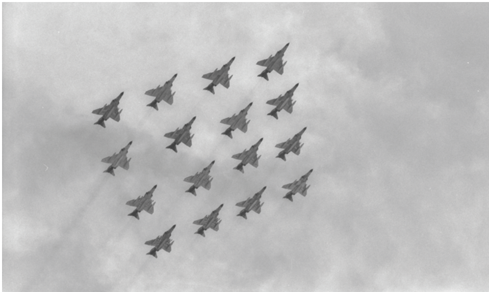
מבנה אווירי של מטוסי פנטום מעל ירושלים, יום העצמאות 1973. בתוכנית 'גושן', שיצאה ב-1970, שם המטה הכללי דגש על התעצמות חילות האוויר והשריון.

הסד"כ הימי המתוכנן ל־31 במארכ 1973 כלל שתי צוללות, 12 סטי"לים ועשרה נט"קים (על הסד"כ הימי המתוכנן ב"גושן" ראו לוח 3 בנספח). כמו כן הציעה תוכנית "גושן" לבדוק אפשרות להוסיף עוד שישה סטי"לים, אולם היא לא כללה אותם בסד"כ המתוכנן. היה בכך משום פשרה בין דרישות חיל הים לצי של 18 סטי"לים בים התיכון ובין אילוצי תקציב, מגבלת כוח אדם וסדר הקדימויות בבניין צה"ל שהקנה חשיבות משנית לפיתוח חיל הים לעומת העוצמה האווירית והשריון.