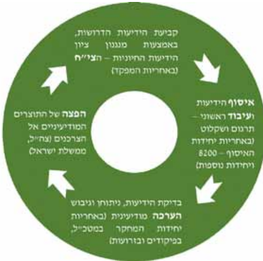
תמונה 43: תרשים המתאר את "מעגל המודיעין".

תפיסת מעגל המודיעין יצרה את "החומות" בין יחידה 8200 ובין מערך המחקר, הן מבחינה מבנית והן מבחינת תהליך העבודה הטורי, המכונה "מסלול ייצור הידיעה" 7 . תהליך העבודה על הידיעה המודיעינית מתבצע בבלעדיות ובסגירות של 8200, ומכוון להוצאת תוצר איסופי עם תוקן ברור לאיכות הידיעה