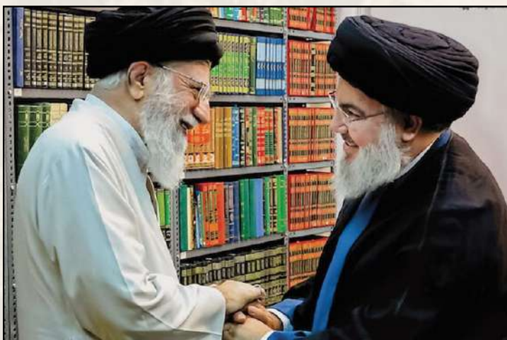
חסן נסראללה, מזכ"ל חיזבאללה (חוסל בספטמבר 2024) ועלי ח'אמינאי, המנהיג העליון של איראן (חוסל בפברואר 2026)

ב-28 בפברואר 2026 החל צה"ל במבצע "שאגת הארי" , בשיתוף עם ארה"ב, כנגד איומים הנשקפים מהרפובליקה האסלאמית של איראן - במטרה להביא לפגיעה יסודית במשטר הטרור האיראני ולהסיר איומים קיומיים על מדינת ישראל . במכת הפתיחה של המבצע חוסל עלי ח'אמינאי, המנהיג העליון של איראן. בתגובה לחיסול, ארגון הטרור חיזבאללה שיגר מתקפת רקטות וכטב"מים מדרום לבנון לכיוון הגליל וחיפה, בכך, חיזבאללה הפר את הפסקת האש שהחלה עם סיום מבצע 'חצי הצפון' בנובמבר 2024, והצטרף למערכה לצד משטר הטרור האיראני . צה"ל תקף את חיזבאללה בעוצמה והרחיב את אחיזתו בדרום לבנון, במטרה להגן על התושבים והיישובים בצפון הארץ ולפגוע קשות בארגון הטרור .