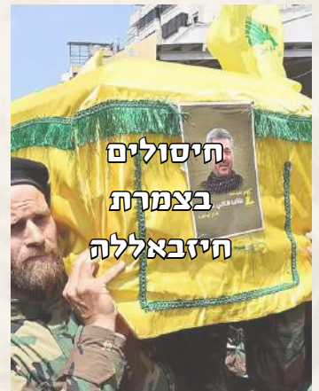
היסולים בצמרת חיזבאללה