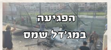
הפגיעה במג'דל שמס

ב-30/7/24 חוסל המפקד הצבאי הבכיר ביותר בחיזבאללה, פואד שוכר, שהיה גם יועץ קרוב לנשראללה וחבר מועצת הג'יהאד