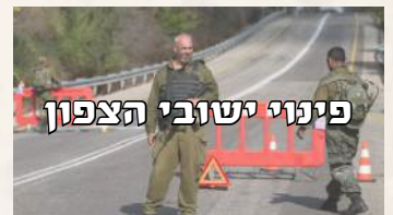
פינוי ישובי הצפון

ב-18/10/23 החל פינוי האוכלוסייה האזרחית הנמצאת בטווח של עד 3.5 ק"מ מהגבול הצפוני של מדינת ישראל, בהתאם לתוכנית צה"ל "מרחק בטוח צפון".