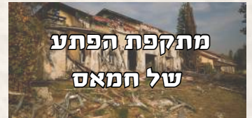
מתקפת הפתע של חמאס

ב-7/10/23 פתח ארגון הטרור חמאס במתקפת פתע על מדינת ישראל