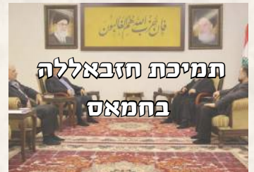
המסיבת הזבאללה בחמאס

יום לאחר מתקפת הטרור של חמאס על ישובי מערב הנגב, פתח חיזבאללה במתקפה יזומה על ישראל. חיזבאללה הצהיר כי הוא ימשיך בהתקפות על ישראל כל עוד תימשך הלחימה ברצועת עזה, כביטוי לסולידריות של 'ציר ההתנגדות'. ישראל הגיבה בירי טנקים, תקיפות מל"טים וירי ארטילרי על עמדות חיזבאללה ליד גבול ישראל-לבנון.