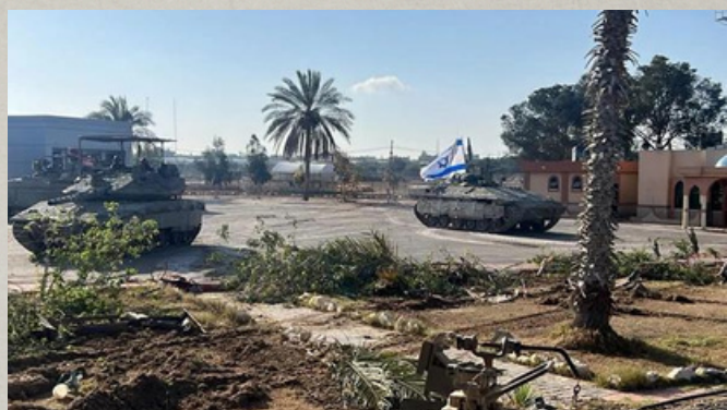
כוחות צה"ל בציודו הפלסטיני של מעבר רפיח

כרוזי צה"ל הקוראים לאוכלוסייה להתפנות מאזורי הלחימה ברפיח