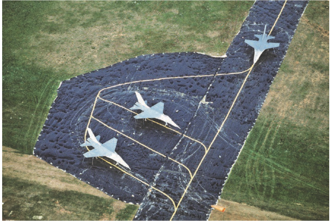
הונאה ויוזאלית - שדה תעופה דמה

במהלך שני העשורים האחרונים השתנה מושג ה"תודעה". העיסוק המסורתי בתודעה כביטוי להונאה, ל"פ ול"ם שבו המרכיב הדומיננטי היה ההשפעה על תודעת האויב, הלך והצטמצם לטובת עיסוק גובר של המערכת הצבאית בלגיטימציה צבאית ישראלית כלפי הקהילה הבינלאומית וכלפי הציבור הישראלי [10] .