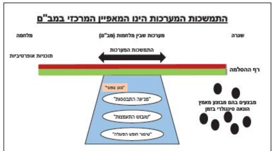
תרשים 2: התמשכות המערכות כליבת הרעיון בהתפתחות המב"ם

מהאמור לעיל עולה כי אם ברצוננו להצליח ולהשפיע על "תפיסת העולם" של האויב את תפיסתו את הצד "הכחול" (צה"ל) דרוש לכך זמן רב העשוי להימשך שנים. כדי ליישם זאת שומה עלינו לקיים מאמץ הונאה רצוף ומתמשך שמטרתו העליונה היא "שימור חופש הפעולה" במב"ם. הצורך המבצעי הוא לבצע הונאה אסטרטגית המייצרת תמונה כוזבת בקרב האויב באופן מתמשך, רצוף ומתפתח (הגלמד ומשתנה באמצעות חיכוך יזום). נדגיש כי המאפיין המרכזי הוא הצורך בשימור התמונה הכוזבת לאורך זמן, במיוחד לניהולה נוכח ההבנה של השתנות מתמדת.