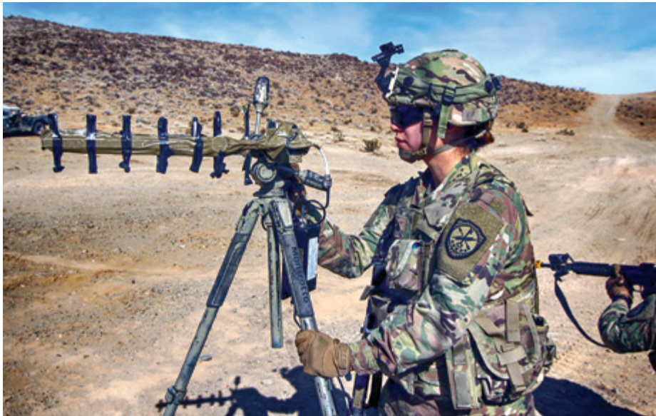
מתמחה בפעילויות במרחב הסייבר בצבא ארצות הברית מספקת תמיכה התקפית בממדי הסייבר והספקטרום האלקטרו־מגנטי. 7

זווית מעט שונה מציג חוקר האסטרטגיה והתיאורטיקן הבריטי, פרופ' קולין גריי, שהיה גם איש הממסד הביטחוני האמריקאי. גריי סיכם את עתיד המלחמה בספר שהוקדש לנושא זה. 8 לדבריו, נוכל להבין טוב יותר את עתיד המלחמות אם נפתח מודעות היסטורית