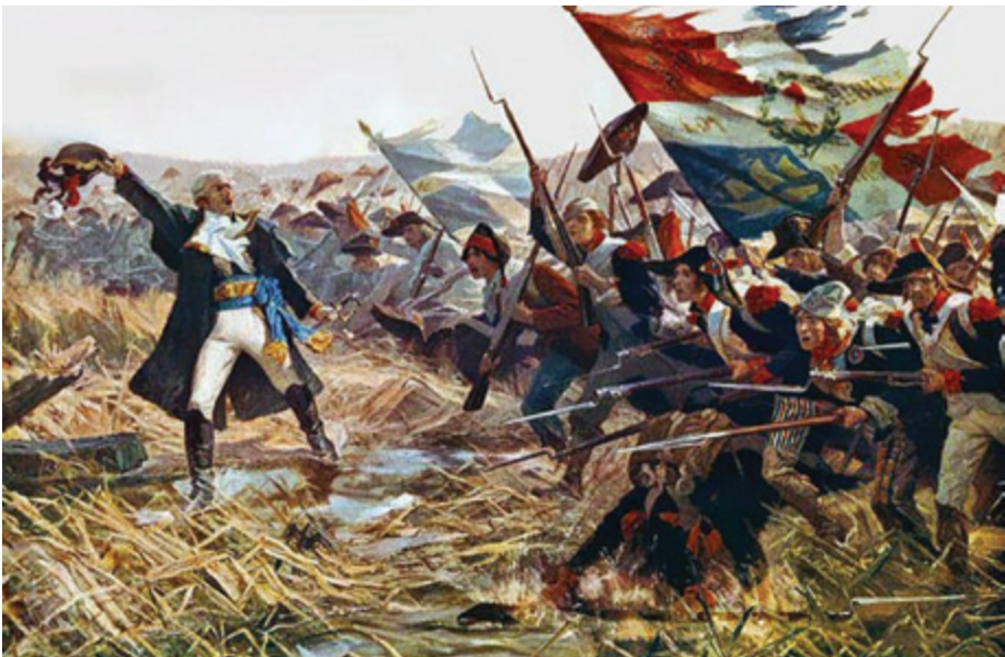
הצבא הצרפתי ב־1792 - הצבא העממי המודרני הראשון ששינה את פני המלחמה. (ויקיפדיה, Français: Bataille de Jemmapes 1792)