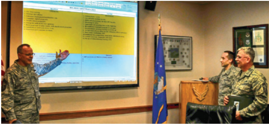
חיל האוויר האמריקאי משתמש בניתוח SWOT - דוגמה לכלים לניתוח אסטרטגי השאולים מעולם העסקים.

הביטחוני-צבאי, עם גוף הידע המתהווה, שינק מן העולם הניהולי והעיסקי. ביטוי מעניין לתופעה זו ניתן למצוא בספרות המדע הפופולרי. הדבר הוביל לכך שאנו מצויים כיום במצב שבו הפרקטיקנים במגזר העיסקי והביטחוני כאחד רותמים את הכלים והשיטות של התיאוריה האסטרטגית לשימור הרלוונטיות או להשגת עליונות ויתרונות תחרותיים בשוק. הם עושים זאת באמצעות התאמות בתוך הארגון ובאסטרטגיה שלו, אל מול היריבים והשותפים במרחב העיסקי שלהם.