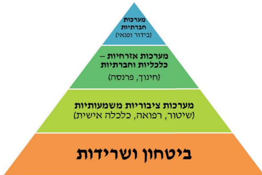
תרשים 3: פירמידת הצרכים בעורף

אפשר לתאר רבדים אלו כ"פירמידת צרכים" (בדומה לפירמידת הצרכים של מאסלו). 26 פירמידה זו נועדה לייצג את השאיפה בעת חירום להתאוששות כלל המערכות מן המשבר וחזרתן לפעילות שגרתית. הרצון בשעת מערכה צבאית הוא להתבסס בשלב גבוה ככל האפשר בפירמידה זו, כאלמנט המסמל הישגים רחבים יותר. ככל שנעמיק את ההישג בעורף נוכל לממש את הצרכים במדרגות הגבוהות. כל רובד בפירמידה נשען על קודמו וקשה לדלג בין השלבים (אך לעיתים אפשר). לכל מרחב בלחימה פירמידה משלו, על פי יכולתו לפעול, והשאיפה של כל מרחב תהיה להתאושש ולהחזיר את כלל המערכות לתפקוד. הפירמידה יכולה לנתח בדיעבד אירועים כדי להבין את מידת ההצלחה בהם בהיבט השמירה על השגרה. לדוגמה, במלחמת המפרץ בוטלו לימודים באזורים נרחבים בארץ, התפנו אנשים ממקום מגוריהם ובוטלו אירועי תרבות ופנאי. לפיכך, אפשר להבין כי בעימות זה העיסוק היה בעיקר במדרגה הראשונה של הצרכים, והמדרגה השנייה תפקדה כי האתגר היה מצומצם. לעומת זאת, אם נסתכל לדוגמה על "צוק איתן" נוכל להבחין בין אזורי עימות שבהם מימוש הצרכים היה בעיקר במדרגה הראשונה (אך בחלקם התקיימו פעילויות לכך במדרגות גבוהות יותר) ובאזורים נרחבים בארץ הפעילות הייתה קרובה מאוד למדרגה העליונה.