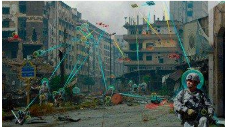
תמונה 5: שילוביות כל הממדים בשדה הקרב העתידי.

לסיכום פרק זה, הצבא האמריקאי מאיץ את ההיערכות למערכה כוללת נגד סין ורוסיה, לחיזוק ההרתעה ולשימור עליונותו הצבאית על יריביו. תפיסת הפיקוד והשליטה של שילוביות כל הממדים, במידה ותתממש, תהווה קפיצת מדרגה ביכולת לשלוט בתמונת המערכה, להפעיל יכולות בזמן רלוונטי, ולקבל החלטות מהירות ואוטומטיות. הרעיון של אוונס מפני שלושה עשורים, של "הסרת ערפל הקרב" באמצעות שליטה במידע ואוטומציה מלאה של תהליכי הפצת המידע והפעלת יכולות תקיפה, שב למרכז השיח והעשייה הצבאית האמריקאית.