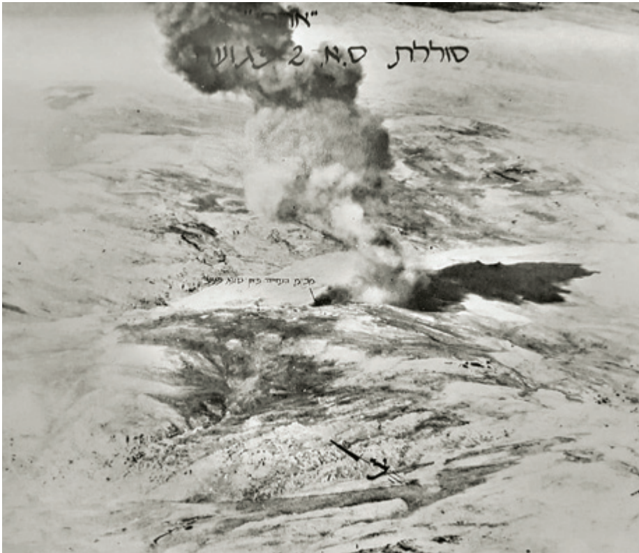
פגיעה במכ"ם סוללת S.A.-2.

נקיים ממטוסי אויב, כך שמבצע תקיפת הטק"א יקבל את כל הנדרש לביצועו. סלע התמקד בלחימה בטילים, ולא היו לו סמכויות או אחריות על כל יתור המשימות, שנוהלו כאמור על ידי עברי. התארגנות פו"ש ייחודית זו הצדיקה את עצמה, שכן תוך כדי תקיפת הטק"א הפעילו הסורים עשרות מטוסי קרב כדי לסייע לסוללות המותקפות. בקרבות אוויר-אוויר (בהקשר ישיר ל"ערצב 19"), אותם ניהל עברי, יורטו על ידי מטוסי קרב ישראליים שהמתינו להם כעשרים מטוסי קרב סוריים. 101 למכלול החלטות פיקודיות אלו הייתה השפעה משמעותית על הצלחת מימושה של היכולת שפותחה בשנים שלפני מבצע "ערצב 19".