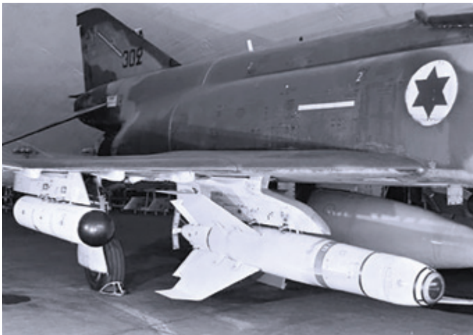
פצצת תדמית מדגם מוקדם על "קורנס".

הטילים האלקטרו-אופטיים היו טילי "תדמית" של רפא"ל ("אגרוף חום") והפצצות האמריקאיות מונחות הטלוויזיה ("אגרוף ירוק"). היה גם "אגרוף צהוב" - פצצת (AGM 62) Walleye אמריקאית רגילה (שנקראה בצה"ל "תשקיף"), שנערכו בה שינויים לצורך הארכת הטווח ולצורך הנחיה.