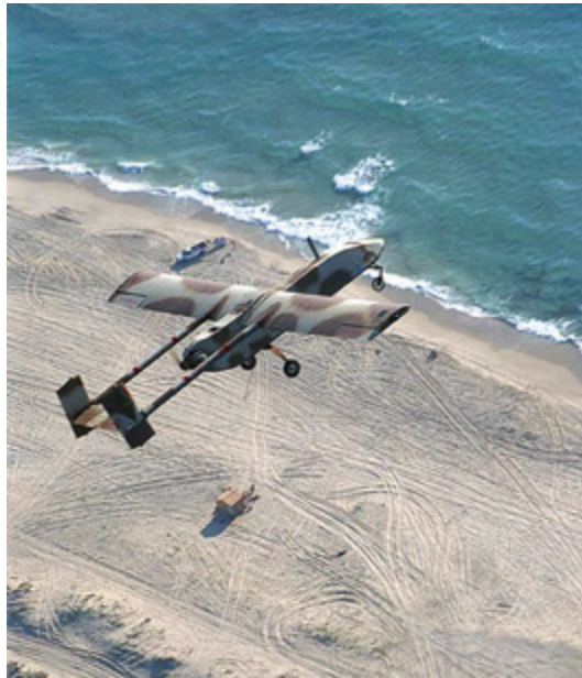
מזל"ט זהבן.

בעדותו כי בשבת, 24 ביולי 1982, נעשה שימוש אינטנסיבי במזל"טי "זהבן" לתקיפת סוללות S.A.-8 שהסורים החלו להכניס ללבנון. 44 לא ניתן היה להעביר בזמן אמת תמונה למטוס התוקף, אלא רק למפקדת חיל האוויר אשר הנחתה את הטייס. 45 איסוף בזמן אמת נעשה באותה תקופה בעיקר באמצעות מודיעין אותות (אלינט), על ידי מטוסי "בואינג" 707 שהוסבו בחיל האוויר למטוס אלינט מעופף ("ראם"). גם המידע האלינטי הגיע לצמ"א ולתשל"ם. יצחק אמיתי ציין לימים כי בתחילת שנות השמונים נעשה ניסיון לצמצם את אליפסת האלינט על ידי שילוב אמצעי איכון מסוגים שונים, ולשלב איכון זה עם היכולת של מצלמת הטלוויזיה לסרוק תא שטח קטן. השילוב הזה נדרש גם לאיכון הסוללות וגם לצורכי בדיקת תוצאות התקיפה לאחר גל התקיפה הראשון. 46 איכון הסוללות ובדיקת תוצאות התקיפה נעשו גם בסיועה של יחידה יבשתית שחיל האוויר הקים לצורכי תצפיות מיוחדות (תצ"ם) - יחידה 5707 שהוקמה לצורך כך ב-1974. 47