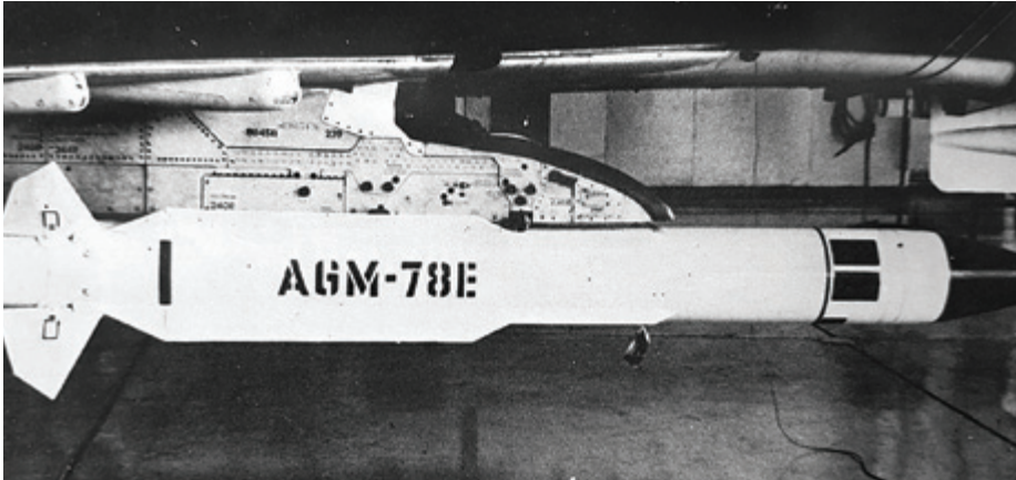
טיל מונחה קרינת מכ"ם - "אגרוף סגול".

והטילים נותרו ללא מטרות. טיל אחד התביית על סוללה סורית באזור דמשק, פנה חדות מזרחה ופגע בה. 79