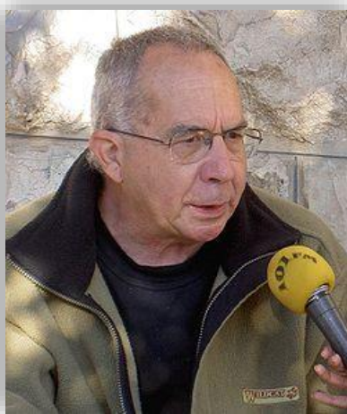
מוטי אשכנזי המשיך בפעילותו הציבורית לאורך שנים ; בתמונה – מוטי אשכנזי מתראיין, אפריל 2007 (ויקיפדיה)

כמובן, מאז פרשת אשכנזי ומלחמת יום הכיפורים התרחשו אירועים רבים, בממשל, במשפט, בצבא ובחברה בישראל, וחלו שינויים מסוימים בתפיסה של בית המשפט, והדיון בסוגיית השפיטות הועמק (ראו למשל את מאמרה של ד"ר דפנה ברק-ארז, לימים שופטת בית המשפט העליון, בנושא "מהפכת השפיטות"). ברבות השנים, היו מקרים שבהם בית המשפט בחן ביתר העמקה את קבלת החלטות במערכות הביטחון והצבא. ואולם, דבריו של בית המשפט העליון לגבי הזהירות הנדרשת בעניינים כגון דא המשיכו וממשיכים לחול ולעורר שיח בקשר לסוגיית השפיטות (ראו למשל את דברי נשיא בית המשפט העליון, אהרן ברק, בפסק הדין בבג"ץ 769/02 הוועד הציבורי נגד העינויים בישראל נ' ממשלת ישראל משנת 2006).