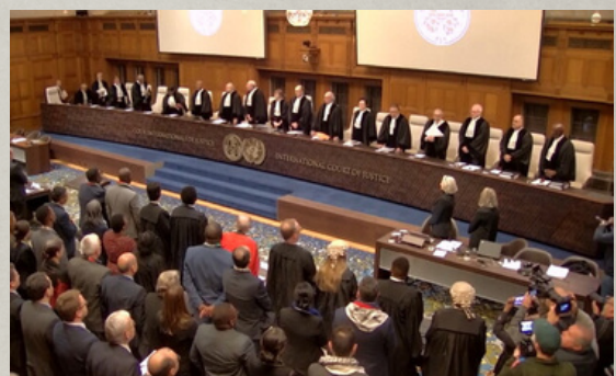
שופטי בית הדין הבין-לאומי לצדק בהאג