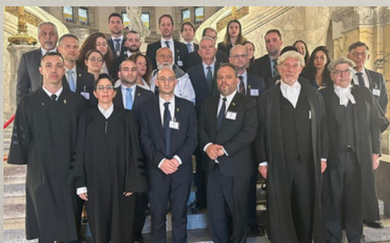
המשלחת הישראלית הכוללת גם משפחות חטופים

התביעה במשפט הציגה כראיות להאשמותיה נגד ישראל תמונות וסרטונים אותם העלו משרתי צה"ל לרשתות החברתיות. הסרטונים תיארו פעולות מבצעיות של חיילי צה"ל כנגד האויב והוצגו באופן מסולף. כמשרתים, עלינו להקפיד הקפדה יתרה על דרך ההתבטאות שלנו ולנהוג באחריות בעת העלאת חומרים לרשתות החברתיות. התביעה בהאג הוכיחה כי אויבינו עשויים להשתמש לרעה בהתבטאויות, תמונות וסרטונים של חיילי צה"ל כנגדנו. גם אמירות ופרסומים שנערכו בתום או ביקשו לתעד את הנעשה עשויים לסבך את המצלם והמצולמים, לפגוע בהשגת יעדי המלחמה ולהסב נזק אסטרטגי למדינת ישראל.