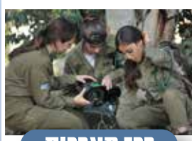
רכז מערכות טנ"א