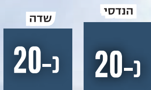
מחזורים של רעון א'