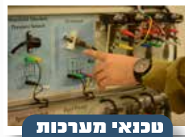
טכנאי מערכות חשמל תומת