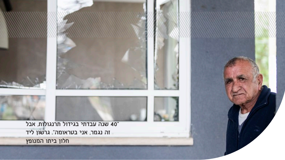
40 שנה עבדתי בגידול תרנגולות, אבל זה נגמר, אני בטרומה. גרשון ליד חלון ביתו המנופץ

מסבירה סגן רוני אופיר, ע. קצין הגמ"ר בחטיבה 300. "אם יש חשש לירי, למשל, אנחנו צריכים לחשוב איך אנחנו מסבירים את זה לאזרחים בלי להלחיץ ובלי ליצור אייטם בחדשות. לתווך את זה במילים שאזרחים יבינו, ויוכלו להמשיך בשגרת החיים שלהם. אנחנו צריכים להבין מה המשמעות – האמא צריכה להוציא את הבן שלה מהגן? החקלאי צריך להפסיק את העבודה שלו? אלו נושאים מאוד רגישים, בעיקר אחרי חמישה חודשים שגם ככה כולם על קוצים". התקשורת הזו קריטית במיוחד למול אופי המצב