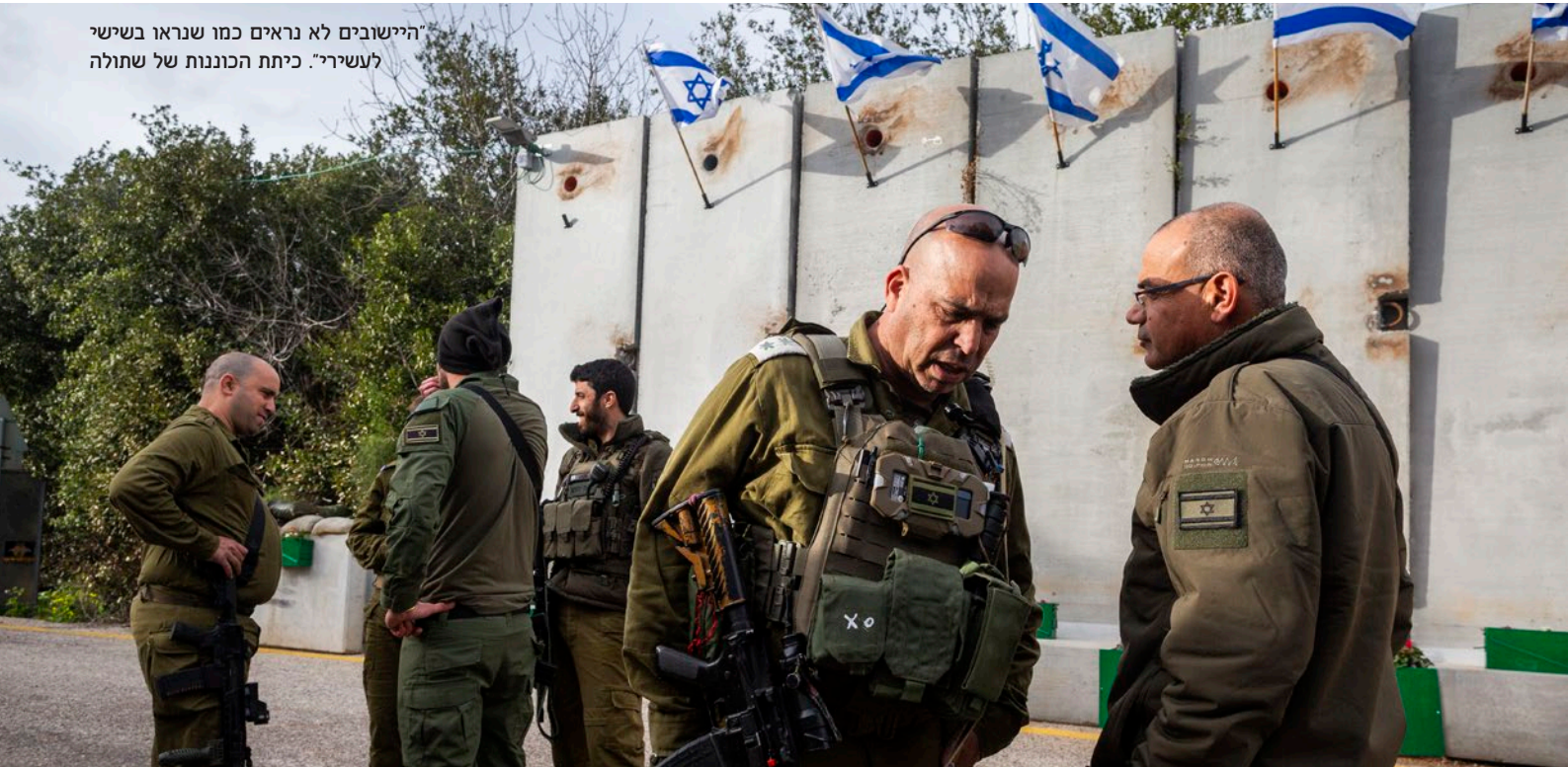
"היישובים לא נראים כמו שנראו בשישי לעשירי". כיתת הכוננות של שתולה

עובדי חקלאות ותשתיות נאלצים להמשיך בעבודתם החשופה על הגבול; לרוב הם גם אלו שמשלמים על כך בחייהם. אגף הגמ"ר בחטיבות המרחביות מתעסק בדיוק בפן הזה – תיווך המצב המבצעי לאזרחים שחייבים לעבוד באזור. "כשאתה רוצה להגיד לכוחות צבאיים לעלות על שכפ"ץ וקסדה, אתה יכול להשתמש בביטויים כמו 'כוננות ספיגה' או 'גשם סגול'. לאזרח אין 'כוננות ספיגה', אין לו מה לעשות עם ביטוי כזה",