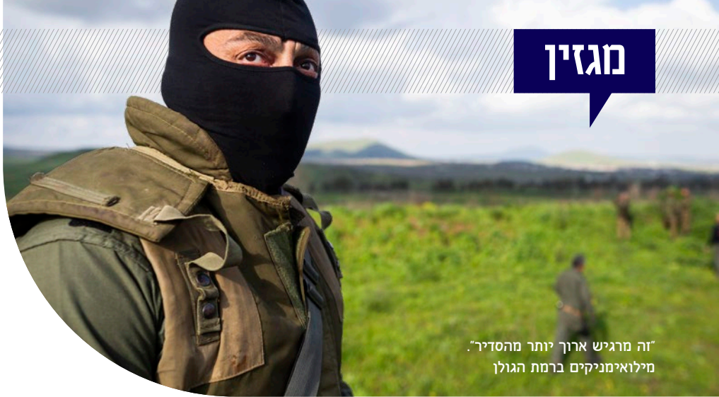
"זה מרגיש ארוך יותר מהסדר". מילואימניקים ברמת הגולן

הקשר עם היישובים, ובמיוחד עם הרבש"צים, מעסיק את הכוחות לא מעט. אמנם כל היישובים במרחק של 5 ק"מ מהגבול פונו, אבל עשרות