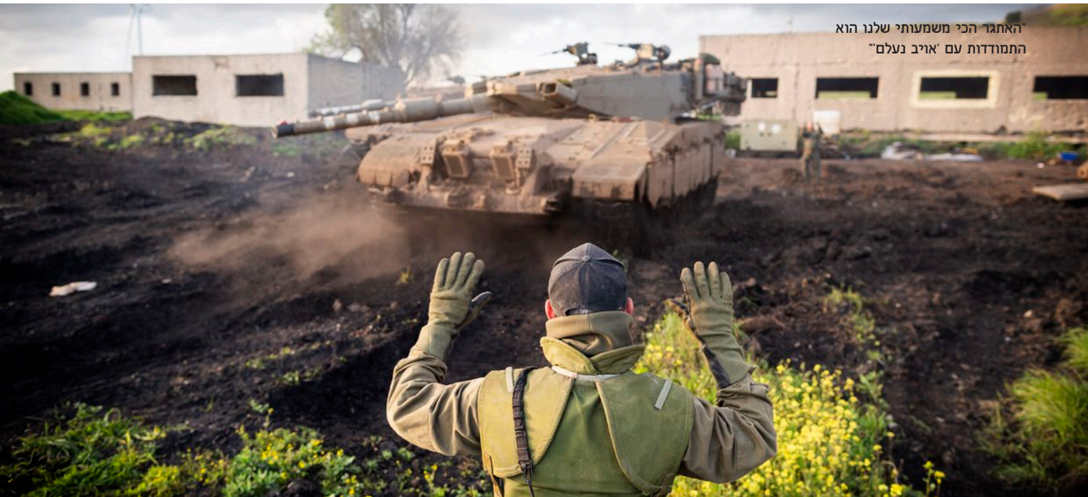
"האתגר הכי משמעותי שלנו הוא התמודדות עם 'אויב נעלם'"

היכולות שלהם, אבל אנחנו כן מאותגרים מבחינת היכולת להפיל ולשבש אותם, לגרום להם שלא יטוסו", מסביר סא"ל (מיל) רזילי. "הכטב"מים מעוררים באנשים פחד קמאי שכזה. גם מנהרות וגם כלי שבא מהשמיים, אני לא יודע מה ייפול עליי פתאום".