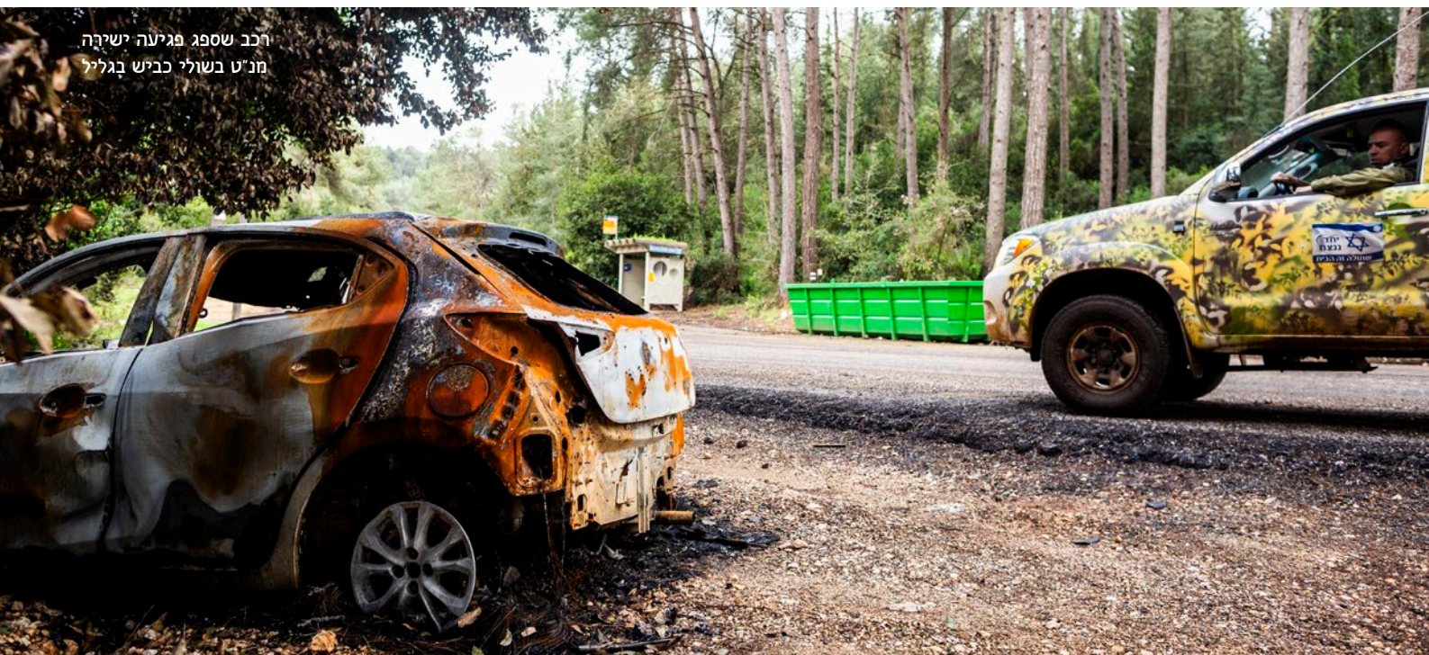
רכב שספג פגיעה ישירה מנ"ט בשולי כביש בגליל

את בארי, החזקנו את הגדר, נלחמנו בבית חאנון. השתחררתי, פיטרו אותי מהעבודה, נעשיתי מובטל – ועכשיו אני שוב במילואים, בגולן. אני כבר ויתרתי על השנה הזו, מבחינתי זו שנת מלחמה".