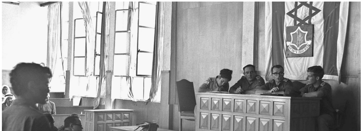
בית משפט צבאי ברצועת עזה, 15 באוגוסט 1967

בעיניי, הכרת הפסיקה ובפרט פסיקה מכווננת כמו פסק הדין בעניין זוהר היא אבן דרך הכרחית במסלול הכשרתו של כל תובע במערכת המשפט הצבאית באזור יהודה ושומרון.