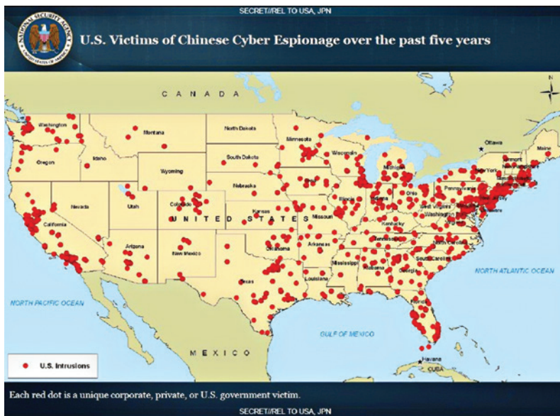
600 מוקדים של התקפות סייבר על חברות אמריקאיות שבוצעו על ידי האקרים סיניים (NSA, USA)

כמו רוסיה, גם סין אינה משתמשת במונח 'סייבר' אלא במונח 'מידע' גם בהקשר של לוחמת סייבר. הסינים משתמשים במונח 'לוחמת סייבר' רק אם הם מתארים את פעולות המערב בתחום מבצעי הסייבר. 85