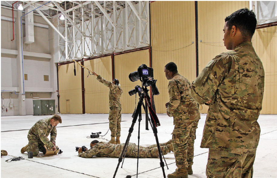
תיעוד איש לוחמה פסיכולוגית בזמן הדגמת יכולת 65

במהלך שנת 2018 עבר צבא ארצות הברית תהליך שבמסגרתו הוא פעל למזג בצורה הדוקה יותר בין לוחמת המידע ובין לוחמת הסייבר. תהליך זה בא לידי ביטוי באיחוד ההכשרות לחיילים בתחומי לוחמת הסייבר 66 והלוחמה האלקטרונית ופיתוח צוותים ללוחמת סייבר אלקטרו־מגנטית. הצוותים יוטמעו באוגדות ויבצעו משימות ספציפיות. 67 השילוב בין שני התחומים מתבצע היום בפועל, ופיקוד הסייבר אינו עוסק רק בתקיפות סייבר אלא גם בלוחמת מידע ובלוחמה אלקטרונית. 68 העמקת השילוב הכרחית, אפוא, על מנת להפיק את המיטב מכל תחום. 69 השילוב בין היכולות נדרש גם לאור העובדה שאצל היריבות של ארצות הברית כבר מתקיים השילוב בין התחומים. המלחמה באוקראינה (שבה שילב הצבא הרוסי בין לוחמת