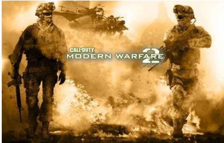
תמונה 2: מתוך המשחק Call of Duty / Modern Warfare II

השוואת המציאות למשחק מחשב, כמו גם הסרטים התודעתיים, מייצרים בקרב צעירי המערב את התפישה כי לקום וללכת ולהילחם בסוריה "קל כמו לצאת לחופשה לדיסנילנד" ובארגון "המדינה האסלאמית" מבינים היטב את פוטנציאל הקונטציה הזו.