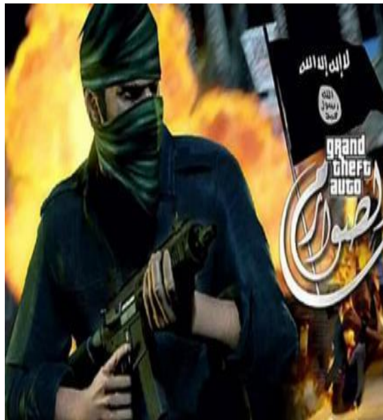
תמונה 3: מתוך הפרומו שהופץ על ידי הארגון לגרסה שלהם למשחק הפופולארי Grand Theft Auto/

בראשית יולי השנה שחרר הארגון סרט בשם Flames of war, השונה בתכליתו מהסרטים הקודמים. הסרט, לעומת קודמיו שהכוונו אל הקהל המוסלמי, מכון לקהל יעד מערבי והוא מתורגם במלואו לאנגלית. הלוחם המרכזי דובר אנגלית רהוטה בדומה לג'יהדי ג'ון והסרט מעט מעודן יותר מקודמיו מבחינת כמות ועוצמת הזוועות המוצגות בו. הארגון דאג, לראשונה, לטשטש חלק מהזוועות, כיאה למסר המוכוון לקהל מערבי. קטעי הלחימה מלוטשים יותר, ומתקשרים בצורה ישירה עם סדרת משחקי ה- Call Of Duty.