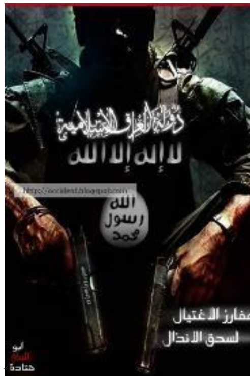
תמונה 4: כרזה לסייבר ג'האד

גם אם מדובר בכלי אימון ללוחמים פוטנציאליים וגם אם מדובר בעיקר בכלי תעמולה, כפי שטוענים אחרים, הרי ברור שבכל הנוגע לתעשיית המשחקים זהו קצה הקרחון.