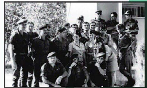
סגל ענף מודיעין קרבי - חווארה 1969

בשנת 1969 הנהה ר' אמ"ן דאז, האלוף אהרון יריב, כי יש לרכז את כל שלוחות ההדרכה של יחידות המודיעין השונות תחת קורת גג אחת. זאת, במטרה להנהיג רמה אחידה ופיקוח צמוד על תכני ההכשרות. את משימת הקמת הבה"ד החדש הטיל ר' אמ"ן על אל"ם גדעון מחניימי, שעם צוות מדריכים מצומצם החל בפעולות הדרושות להקמת בסיס ההדרכה של חיל המודיעין. המיקום שנבחר - מחנה "גלילות" מקומו הנוכחי של הבה"ד. יצויין כי לתכנון בה"ד 15 בגלילות תרם רבות סא"ל רומי בן פורת ז"ל.