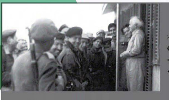
ביקור קורס קמ"נים ב-1954 אצל דוד וכולה בן גוריון בצריף בשדה בוקר

עד 1954 כלל מערך הקורסים בין השאר: קורס בסיסי לפקידות/פקידי מודיעין; קורס שרטוט; קורס סמלי מודיעין לסדיר ולמילואים; קורס סמלי סיור; קורס קמ"נים גדודיים וקמ"נים חטיבתיים לסדיר ולמילואים; קורס בסיסי וקורס מדריכי טופוגרפיה; קורס פענוח תצ"א. בנוסף התקיים קורס "מודיעין ממלכתי גבוה" שהיה משותף לכל זרועות קהילת המודיעין (גלגולו הראשון של הקב"ש).