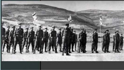
סיום קורס קמ"נים במחנה חווארה, 1969

באצמע 1955 הועבר בה"ד 15, זמנית (עקב מצב התשתית הרעוע ברמלה) למחנה "גלילות" (כיום - מתחם פו"ם) שם שכן מחנה של הגדנ"ע. לקראת סוף 1955 הועבר מכלול ההדרכה (שוב) למחנה "דורה" שליד נתניה, כענף מודיעין קרבי בתוך בה"ד 3, בית הספר למקצועות חיל הרגלים. הענף היה כפוף מקצועית ל-חמ"ן וארגונית ל-בה"ד 3. עם השלמת המעבר למחנה "דורה" הוקם ענף מודיעין שאיחד את כל ההדרכות והקורסים בתחום המודיעין הקרבי, דוגמת הקורסים שהתקיימו קודם לכן בבה"ד 15 ברמלה. קורסים מקצועיים ייחודיים התקיימו במקביל ביחידות החיל המקצועיות.