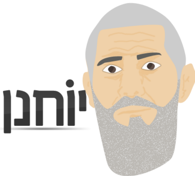
איור 2: מערכת "יוחנן" – אתר הקוד הפתוח ברשת הצה"לנט

ניתן להתרשם, אם כן, כי האימוץ והשימוש בקוד פתוח רווח בקרב המפתחים הצעירים בצבא, זכה לתמיכה והכוונה ברמת ההנהלה הבכירה, לפחות באגף התקשוב. ואכן נעשתה בו עבודה משמעותית בשנים האחרונות, 54 ואף בוצעו מספר האקטונים. 55 באשר לשיתוף פעולה בכתיבת קוד ניתן לראות מספר דוגמאות בצורת GitHub, אשר נעשה בו שימוש פנימי באמ"ן, בחיל התקשוב, בחיל האוויר ועוד, אך מבחינת שיתוף הפעולה של קהילת מפתחים אזרחית עם הצבא, ניתן לראות כי התחום נמצא רק בראשית דרכו. לסיכום, צה"ל נמצא בדרכו לקראת הפנמה של עולם הפיתוח הפתוח. הכשרת תכניתנים ע"י אגף התקשוב מכניסה מעגלים הולכים וגדלים של בעלי