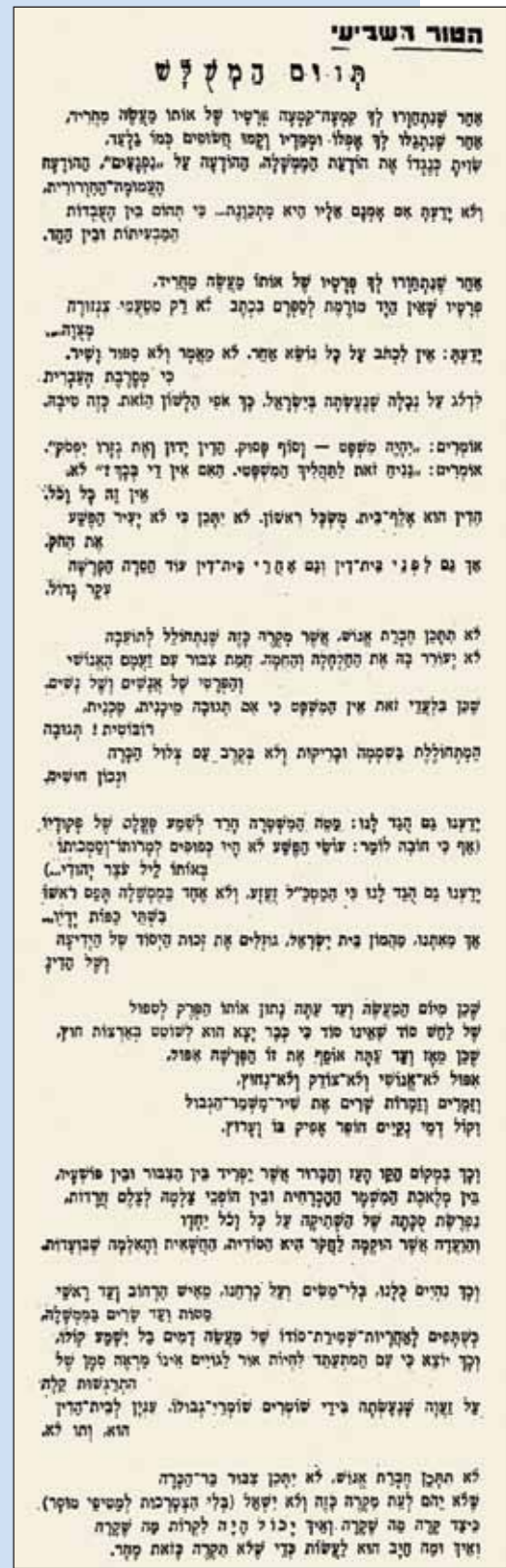
נתן אלטרמן, "הטור השביעי", עיתון דבר, 7 בדצמבר 1956

"סימן היכרה של פקודה 'בלתי חוקית בעליל' - מן הדין שיתנוסס כדגל שחור מעל לפקודה הנתונה, ככתובת אזהרה האומרת: 'אסור!' לא אי חוקיות פורמלית, נסתרת או נסתרת למחצה, לא אי חוקיות המתגלה רק לעיני חכמי משפט חשובה כאן, אלא: הפרת חוק גלויה ומובהקת, אי חוקיות ודאית והכרחית המופיעה על פני הפקודה עצמה, אופי פלילי ברור של הפקודה או המעשים שהפקודה מצוה לעשותם אי חוקיות