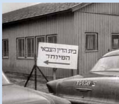
הכניסה לבית הדין הצבאי המיוחד, 1959; מתוך סדרת הטלוויזיה "תקומה"

צירוף העונשים המצויים בדין הכללי עם העונשים הייחודיים בחוק השיפוט הצבאי יוצר תמהיל ההולם את מאפייניה של ערכאת שפיטה פלילית בתוך מסגרת צבאית.