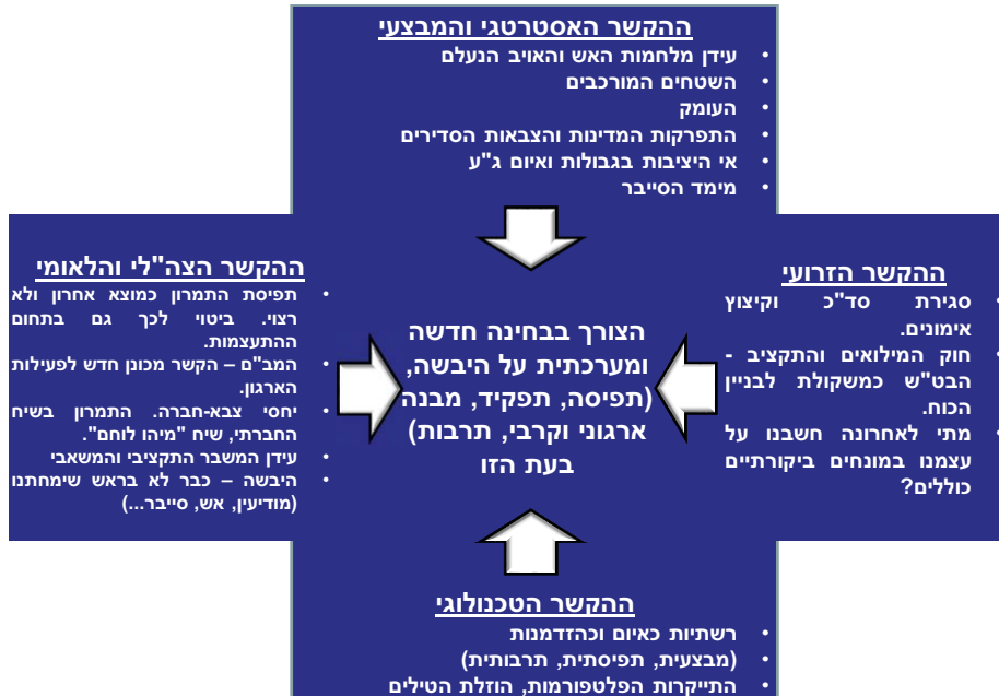
איור 1 – מקורות הצורך במחשב אסטרטגי, מתוך מצגת התנעת 'יבשה באופק', מאי 2014

העיצוב שתבוסס על צוותי עבודה נושאים, בראשות תתי-אלופים, שיזינו את הפורום המרכזי בניתוחים ביקורתיים על הנושאים שיוגדרו; (3) לוח זמנים – גיבשנו תכנית לשלב העיצוב שנועד להימשך עד סתיו 2014.