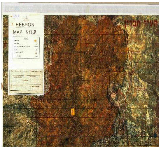
מפה מס' 9 להסכם ביניים ישראלי-פלסטיני בדבר הגדה המערבית ורצועת עזה (28 בספטמבר 1995)

בשנת 1996 הגישו חלק מבעלי המקרקעין שבתחום צו התפיסה, עתירה לבית המשפט העליון בשבתו כבג"ץ, נגד הצו. הטענה המרכזית שהועלתה על ידי העותרים הייתה כי המפקד הצבאי נעדר סמכות להוציא צו תפיסה במקום בו במקרקעין האמורים, שכן הסמכויות במקום הועברו לידי הצד הפלסטיני בהסכם הביניים ובנספחו. העותרים טענו כי המקרקעין מושא הצו מצויים בתחום H-1, המצוי בשליטה של הצד הפלסטיני, ולא בתחום שטח C, המצוי בשליטת הצד הישראלי. את טענתם סמכו העותרים על מפת העיר חברון שצורפה להסכם הביניים (מס' 9), ועמדו על כך שמפה זו גוברת על המפה הכללית שצורפה להסכם הביניים, בה נקבע כי השטח הרלוונטי הוא בתחום שטח C. עוד טענו העותרים כי אין צורך ביטחוני בסלילת הכביש.