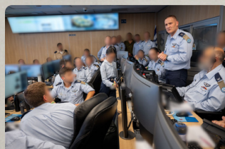
מפקד חיל האוויר בבור במהלך המבצע