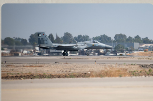
מטוס חה"א בהכנה לתקיפה

איראניים לארגון החות'ים, ומקור כלכלי משמעותי עבורו. המבצע דרש תכנון קפדני והיערכות למגוון איומים אפשריים במרחב, ובמהלכו נערכה התקיפה המרוחקת ביותר משטח מדינת ישראל שבוצעה אי פעם על ידי חיל-האוויר, במרחק של למעלה מ-1,700 ק"מ.