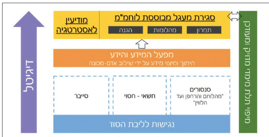
איור 2: יכולות ליבה בתפיסת העליונות המודיעינית

מיפוי - עולם המיפוי עבר מהפכה של ממש בעשור האחרון. כיום בכל מכשיר סלולרי ניתן לקבל תמונה תלת ממדית מדויקת ומעודכנת של כמעט כל מקום בעולם. יכולות אלו מהוות הזדמנות חסרת תקדים לעיגון כלל התובנות ממפעל המידע והידע על גבי מפה דיגיטלית - ובכך להוריד את הדיגיטל לשטח.