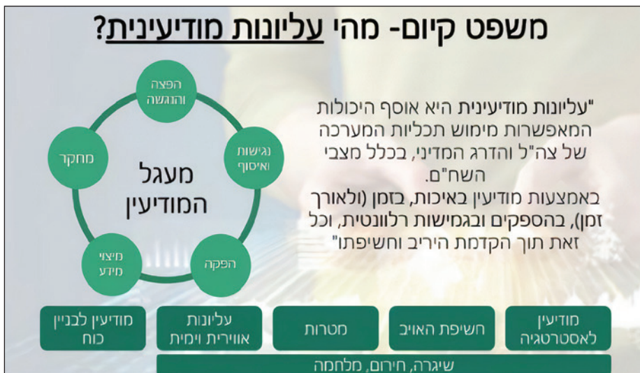
איור 1: עליונות מודיעינית - הגדרה מחודשת

כדי לסייג ולדייק את התיאור השאפתני לעיל של ההישגים הנדרשים חשוב להדגיש כי ההסתכלות על עליונות מודיעינית כעל רף בינארי (או שיש או שאין) היא מטעה . בפועל בשל מגבלות משאבים, אך גם בשל הקשרים שונים וזירות פעולה שונות, קיימות רמות של עליונות מודיעינית . בפרט קיים הבדל בין רף הישג מוחלט ("עליונות מודיעינית ניצחת" שהיא קשה עד מאוד להשגה), שבו יש לנו יכולת פעולה ואפקטיביות מודיעינית מלאה, בלי שלצד השני יש יכולת מודיעין משמעותית כלפי ישראל, צה"ל ואמ"ן, לבין רף הישג יחסי ("עליונות מודיעינית"), שבו יש לישראל יתרון מודיעיני על הצד השני במרחב ובזמן נתונים מבלי שהאויב יכול לסכל את מאמצי המודיעין של ישראל.