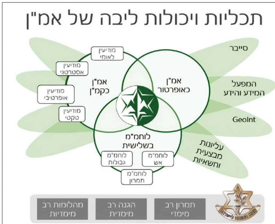
איור 3: תכליות אמ"ן

שאותן ממלא אמ"ן מתוקף תפקידו: אמ"ן כמתאר את המציאות, אמ"ן כאופרטור (מוציא לפועל משימות הפעלת הכוח) ו אמ"ן כמכפיל כוח בשדה הקרב . בפרט בעידן המב"ם עלה השיח סביב תפקידו של אמ"ן כזרוע פעולה שתשמש להלומה תוך שימוש ביכולות ובכלים העומדים לרשותה, כגון סייבר, קומנדו, תודעה, השפעה, שיבוש והונאה, שיש בהם כדי לשנות את פני המערכה למול האויב.