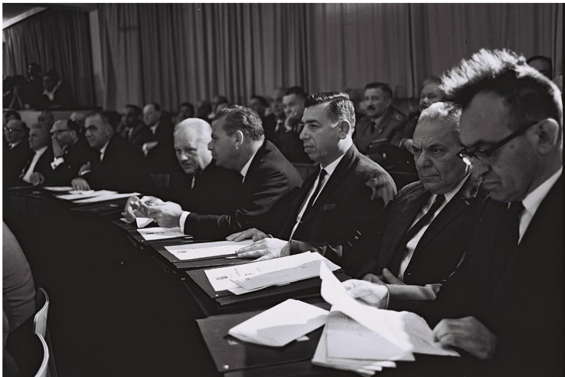
צילום ממושב הפתיחה של הכנסת השישית

הבנת מרכזיות עשייתה של הפרקליטות הצבאית, גם בשיקוף תמונת המצב המשפטית לדרגי מקבלי ההחלטות במדינה בכלל, חיונית בראייתי לכל קצין המשרת בפרקליטות הצבאית.