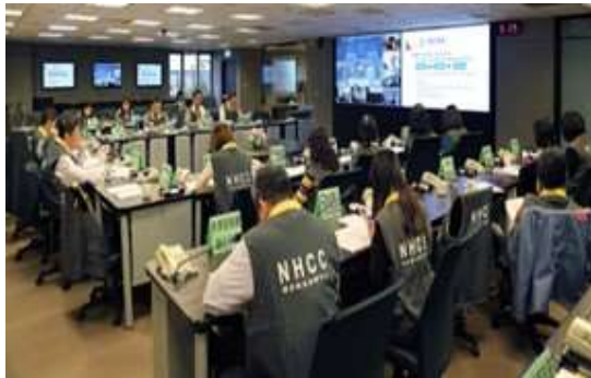
חדר הערכת המצב של מוצב הבריאות הלאומי

6. טאיוואן מזוהה מזה מספר חודשים כמדינה אשר מתמודדת עם המשבר בהצלחה יחסית, בין השאר, בעקבות קיומו של מבנה ארגוני ייעודי אשר אמון על ניהול המערכה המדינתית עם המגפה? 2