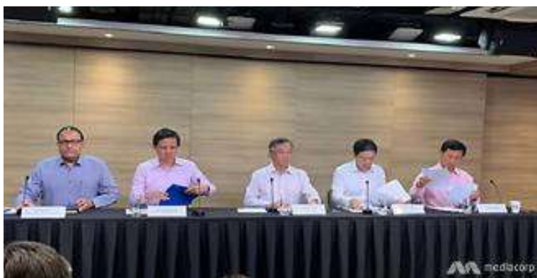
מסיבת עיתונאים משותפת של נציגי כוח המשימה הבין משרדי

14. מבין הצעדים בה נקט כוח המשימה הבין משרדי ושסייעו להתמודדות המוצלחת של סינגפור - הגבלת הכניסה מסין והשמת המגיעים משם בחופשה כפויה או בידוד בית; סגירת גבולות (למעט עם מלזיה); ריבוי הנחיות פומביות לאוכלוסייה; פיצוי ישיר למעסיקים ולעובדים; חקיקת תקנות מחמירות יותר לגבי אוכלוסיות בסיכון; העברת סיוע כלכלי ישיר למעסיקים ועובדים; מיקוד בדיקות למקרים אשר נחשדים כחולים בשל סימפטומים מובהקים.