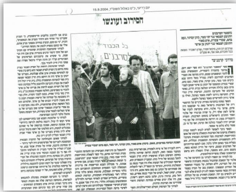
כתבה בעיתון "הארץ" ביחס לפרשה, 15 לספטמבר 2004

בשנת 2003 נערך משפטם המאוחד של חמישה סרבני מצפון שסירבו להתגייס לצה"ל תוך טענה כי הם מתנגדים לשירות בצה"ל ולמדיניות הממשלה באזור יהודה ושומרון. המשפט עורר שיח ציבורי רחב ביחס לנושא הסרבנות, והחלטת בין הדין הצבאי המחוזי במשפט קיבלה את עמדת הצבא ביחס להבחנה בין סרבנות מצפון מטעמי פציפיזם ובין סרבנות סלקטיבית.