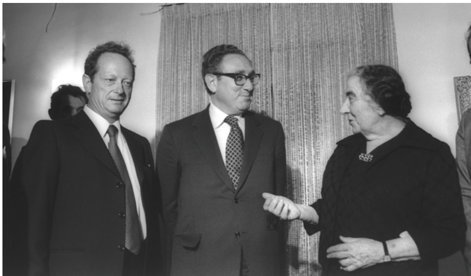
פגישה בבית ראש הממשלה. מימין: גולדה מאיר, הנרי קיסינג'ור ויגאל אלון. 27 בפברואר 1974.

רואים בעצם קיומו של הדו-שיח עם ישראל קורבן גדול, וכי המחיר הכבד ששילמו במלחמת יום הכיפורים מאלץ את אסד לדרוש דרישות מעבר לקו 6 באוקטובר 1973. קיסינג'ור העריך כי הצעה ישראלית המבוססת על נסיגה מן המובלעת בלבד, ללא פשרה מסוימת גם מעבר לקו הסגול, תגרום לאסד לפוצץ באופן מיידי את המשא ומתן. על כן הציע למאיר כי הוא לא ימסור בביקורו הקרוב בסוריה שום תוכנית לאסד, אלא יאמר לו כי ההצעה שהוצגה לו בישראל אינה ראויה ויש לבחון אותה מחדש. במקביל לכך הציע מזכיר המדינה כי ישראל תשגר לווינגטון את שר הביטחון דיין, והסורים ישלחו לשם נציג בכיר מטעמם. קיסינג'ור היה פסימי מאוד בנוגע להשגת הסדר שלום עם הסורים, בניגוד להסדר כזה עם המצרים, מאחר שהיה בהיר לו שישראל איננה יכולה לסגת מרמת הגולן. במהלך השיחה חזרה מאיר על התנגדותה לנסיגה מהגולן, ועל כך שגם נסיגה מעבר לקו הסגול במסגרת הסכם הפרדת כוחות אינה אפשרית. מזכיר המדינה טען כי סאדאת אמר לו שהעברת קוניטרה לידי הסורים עשויה לגשר בין העמדה הישראלית לזו הסורית. 63