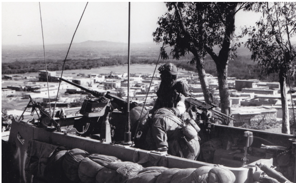
זחל"ם לוחמי חי"ר מגדוד 12 של חטיבת "גולני", סמוך לבית סורי בשטח המובלעת (באדיבות דובר צה"ל).

בסופה של שנת 1973 נהנו הסורים מיתרון של 3:1 לטובתם מבחינת מאוזן הכוחות. כך, למשל, היו להם בחזית אל מול ישראל כ-1,500 טנקים, ואילו לישראל היה כשליש מזה. 34