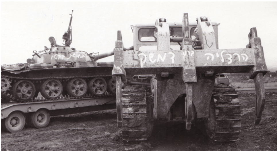
פינוי שלל המלחמה משטח המובלעת - דחפור די-9 וטנק שלל סורי מסוג טי-55. על גבי הדחפור כתוב: "הרצליה דרך דמשק", על גבי הטנק כתוב "תחמושת בבטן".

ב-31 במאי 1974 נחתם הסכם הפרדת הכוחות בין ישראל לסוריה בז'נבה, וב-1 ביוני הגיעו לישראל ראשוני השבויים מסוריה. ב-6 ביוני בוצעו חילופי שבויים בין הצדדים והחלה נסיגת ישראל מתחומי המובלעת. זו הסתיימה ב-26 ביוני עם ההתייצבות של כוחות צה"ל על מתווה קו הגבול החדש-ישן, ובכך באה לסיומה מלחמת יום הכיפורים. 139