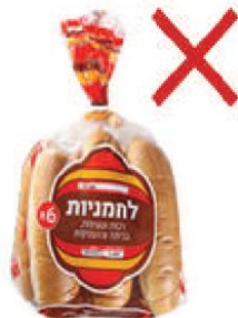
מאפים מפינת אפייה