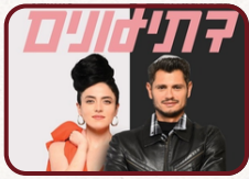
יש להירשם עד התאריך: 13/4

קומדיה רומנטית צעירה ומעוררת הזדהות על דו-קיום בין אמונה לתשוקה, בין החלומות הגדולים להתפכחות המכאיבה, ועל החיפוש אחר המכנה המשותף כשהדת נכנסת לחיים הזוגיים: לא דתיים ולא חילוניים - דתילונים.