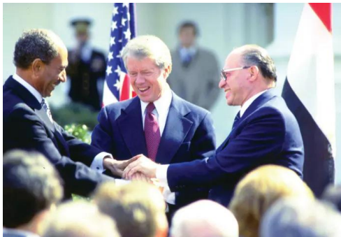
לחיצת יד משולשת בין ראש ממשלת ישראל מנחם בגין, נשיא ארצות הברית ג'ימי קרטר ונשיא מצרים אנואר סאדאת, במהלך חתימת חוזה השלום בין ישראל למצרים

במסגרת הממשל הצבאי שחל בשטחי סיני לאחר מלחמת ששת הימים, הוקנו סמכויות שונות למפקד הצבאי באזור סיני, ובתוכן הסמכות לסגור שטחים.