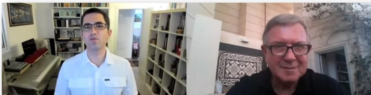
תמונה מתוך הראיון

באותם זמנים, לא היה זה יוצא מגדר הרגיל שכן מדי פעם הגיעו קצינים בכירים להתמחות ואף נקלטו לאחר מכן לתפקידים ביחידה. אל"ם בן-ארי מבהיר, כי אף שהיה מתמחה לא התנהג ככזה ונחשב כיועץ מן השורה. לאחר סיום ההתמחות, הפך בן-ארי לקצין ייעוץ בכיר במפצ"ר.