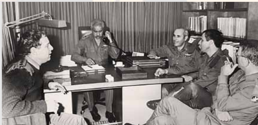
פגישה בחדרו של האלוף מימון, נשיא בית הדין הצבאי לערעורים, בראשית שנות השמונים; מימינו: אל"ם רביד, אל"ם סטרשנוב, תא"ל פרחי, משמאלו: אל"ם מודריק

האלוף מימון חיבר שני ספרים על תקופות בשירותו הצבאי: הטרור שנוצח: דיכוי הטרור ברצועת עזה 1971-1972 (1993), ועקבות בערבה: הלחימה במחבלים בערבה דצמבר 1967 - מרץ 1971 (2005). דוד מימון נשא לאישה את שרה ונולדו להם שלושה ילדים. לאחר שנפטרה נשא לאישה את לאה. האלוף מימון נפטר בשנת 2010.