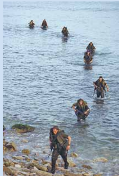
לוחמים בצה"ל מתאמנים במעבר מכשול מים; צילום: נדב גנות

ע/132/82 סגן כהן נ' התובע הצבאי הראשי; פסק הדין ניתן ביום 28 בנובמבר 1982; אב"ד: האלוף נדל, נשיא בית הדין; שופטים: אל"ם רביד; סא"ל בזק