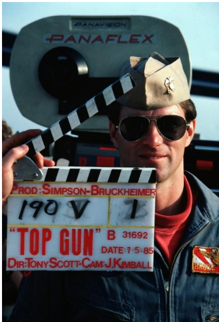
תמונה מצילומי הסרט המפורסם: