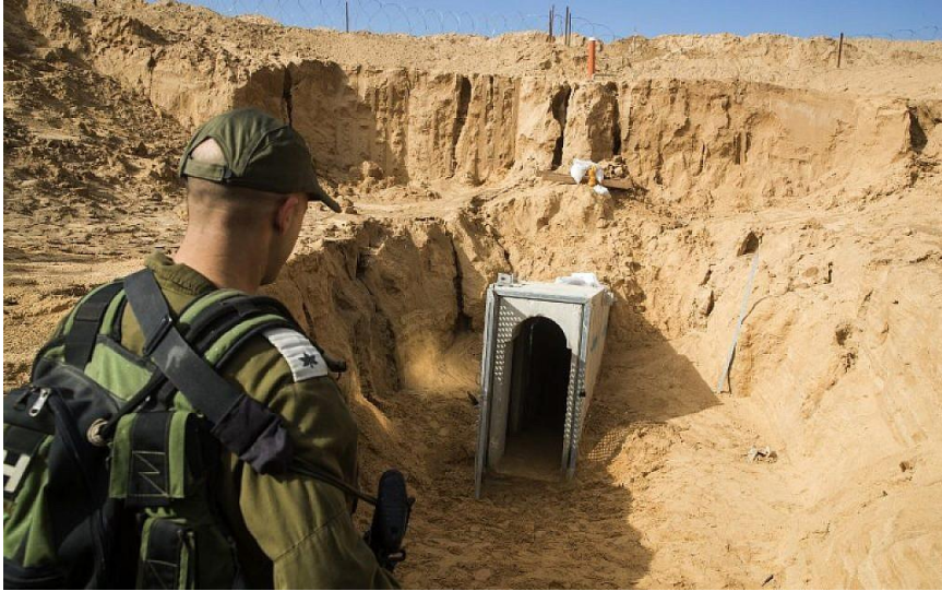
גילוי מנהרה של חמאס באזור עוטף עזה 2016

אופן ההתפתחות של צורת הלחימה האסימטרית משקפת, בקווים כלליים, את רוב מקרי המבחן של היחסים בין הצד האסימטרי החותר לבין הצבא הסדיר. זוהי מערכת יחסים הקשורה בממדים הטקטיים-אופרטיביים. עם זאת במקרה הישראלי האופן שבו התפתחו שני הצדדים זה ביחס לזה לאורך שנים, הביא להתפתחותה של מערכת יחסים משבשת מיוחדת בין חמאס לישראל גם במישור האסטרטגי.