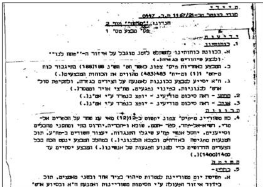
'קלחת מס' 2 - פקודת מבצע מס' 1, 10 בינואר 1970 36

יום לפני הפעולה הוצגה התוכנית בפני הרמטכ"ל. גור הדגיש את חשיבות הפעולה המהירה שנבעה מהמגבלות הפוליטיות והמדיניות הרבות, ואף שם הדגש על איפגועה בצבא לבנון ובאזרחים. הרמטכ"ל בר לב ציין את שתי המגבלות המרכזיות של המבצע: הראשונה מדינית – לבנון היא מדינת חסות מערבית שמשטרה פרו-מערבי, וארה"ב לוחצת כי נימנע ככל האפשר מפגיעה באזרחים ובאנשי צבא לבנונים. המגבלה השנייה קשורה לראייה רחבה יותר של תופעת הפת"ח. בר לב הדגיש את הצורך בזהירות ובהימנעות מנפגעים ככל האפשר, ובשל כך את חוסר הרצון להתעקש על "יעדים קשים". הוא הנחה לעשות שימוש נרחב יותר באש מאשר בהסתערות: 37