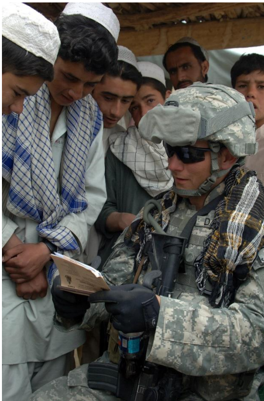
חייל אמריקאי מתשאל תלמידים אפגנים

חוויה מיוחדת הייתה לי לפקד על שורת מג"דים מעולים ולהעמיק יחד ברזי המנהיגות הקרבית. בזכות החיכוך צברנו ניסיון בלמידה מבצעית וטיוב הערכת המצב, התאוששות מכישלונות ופיקוד במצבי איודאות. בנקודה זו קשה להפריז בערכם העצום של היוזמה ו"פיקוד מטרה" בניהול הקרב. טעיתי לא פעם בהערכת המצב, נתתי פקודות שגויות, ועל אחת כמה וכמה בעת אירועים מתפרצים. רק במקום שבו המג"דים נטלו יוזמה, ניסו להשפיע על המח"ט, הרחיבו משימות ושינו אותן לאור המטרה והבנות בשטח, היינו אפקטיביים יותר.