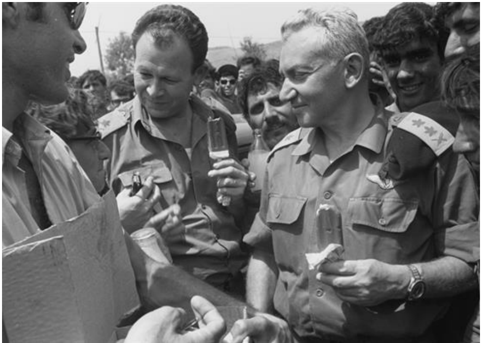
הרמטכ"ל רא"ל חיים בר לב ומפקד פיקוד צפון האלוף מרדכי (מוטה) גור מבקרים את הכוחות לאחר החזרה מלבנון, 14 במאי 1970

לסיכום, אסטרטגיית התשה היא תהליך המכיל בתוכו אפקט מצטבר; המיועד לפגיעה ביכולתו אולם בעיקר (במקרה הישראלי) ברצונו של האויב להילחם; שהצד החלש יכול לנקוט בו, אולם גם הצד החזק שנמנע מלהכניע; ושתוצאותיה פעמים רבות הן מתוננות. 13