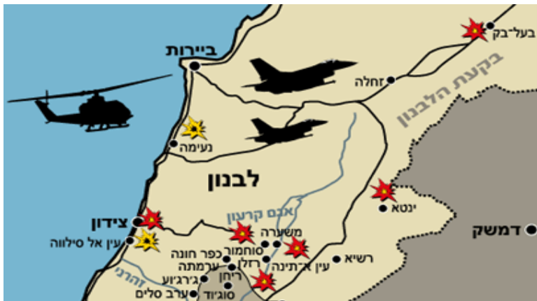
מפת פעולה של מבצע "דין וחשבון" 52

אין פירוש הדבר שפג תוקפה של 'תפיסת דין' בחשיבה הישראלית, אלא שהיא שינתה את צורתה: מבצעי הפעלת הכוח הגדולים בשנות התשעים נגד חיזבאללה בלבנון הראו כי העקרונות הבסיסיים של התפיסה נותרו בעינם, הגם שהיו למבצעים הללו כמה מאפיינים ייחודיים. 50 כמו בעבר היו אלה מבצעים שנועדו להסלמה למטרת מניעת הסלמה. מבצעי האש בלבנון באו כתגובה על הסלמה בלחמה בין חיזבאללה לישראל, והם נועדו להפעיל לחץ כדי למנוע המשך ההסלמה. אולם לא כמו רוב המקרים בעבר, הלחץ היה עקיף שבעקפים: במבצעי "דין וחשבון" ו"ענבי זעם" ב-1993 ו-1996 המטרה הייתה להפסיק את ההסלמה של חיזבאללה, והשיטה הייתה יצירת לחץ על תושבי דרום לבנון שאמורים היו ללחוץ על ממשלת לבנון, כדי שמצידה תפעיל לחץ על סוריה, שנחשבה אז למי ששולטת בחיזבאללה. ואכן, מאות אלפי לבנונים הפכו במכוון פליטים בארצם במהלך "דין וחשבון", וגם ב"ענבי זעם" התרחשה תופעה דומה. 51