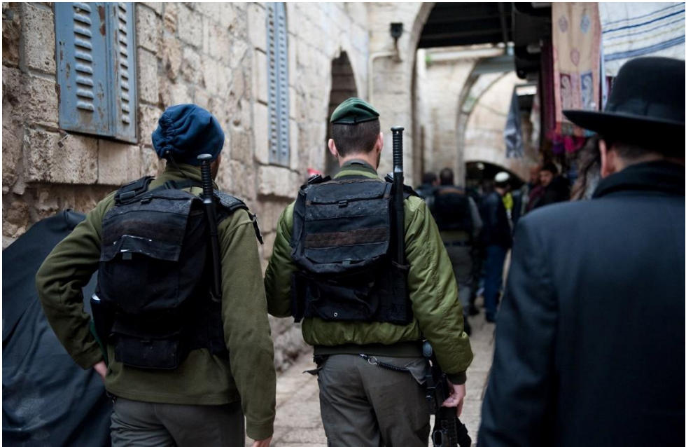
חיילי מג"ב מסיירים בעיר העתיקה

מבחינת פיקוד המרכז, המשמעות המעשית של הבנה זו במהלך מערכת "גודל השעה" הייתה הידוק המעורבות הפעילה של הפיקוד עם מחוז ירושלים של משטרת ישראל וחיבור שאר הגופים והדרגים לנעשה בירושלים (באמצעות ביקורים ייעודיים, למידה משותפת וכדומה). כמו כן התקיימו דיונים ישירים בין הפיקוד לבין גופים שונים העוסקים במערכת הפלסטינית, על מנת לשפר את הבנת המערכת והפעולה המשותפת כלפיה. יתכן כי אם האחריות המרחיבה של פיקוד המרכז ביחס לנעשה בירושלים הייתה ממומשת טוב יותר עם פרוץ האירועים בהר הבית, באמצעות תגבור כוחות ומוכנות גבוהה עוד יותר להסלמה, ניתן היה להנמיך את עוצמת ההתפרצות בשלב מוקדם יותר.