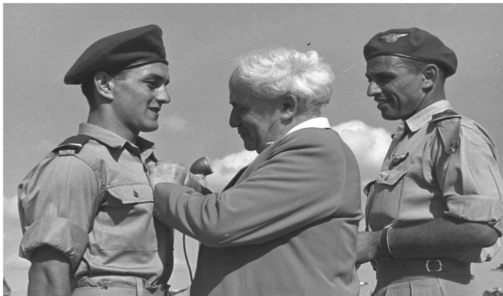
דוד בן-גוריון בטקס הענקת דרגות בחיל האוויר

מול איום 'יסודי' מיידי – צבא בקנה מידה מלא העלול להיות מעוניין לפלוש – המטרה הישראלית המיידית הייתה בדרך כלל למנוע הסלמה. פעולה צבאית אמורה הייתה לבוא רק כאשר ברור היה כי האויב מחפש הסלמה. 15 אולם מול מחבלים, מסתננים וארגוני טרור ושולחיהם, ביקשה ישראל לא פעם דווקא להסלים את המצב, כדי למנוע הסלמה: אם מחבלים מכים בנו, נכה בהם או בשולחיהם או באחראים עד שהמחיר על המשך פעולותיהם יהיה "יקר" מכדי שכדאי יהיה להם לשלמו.