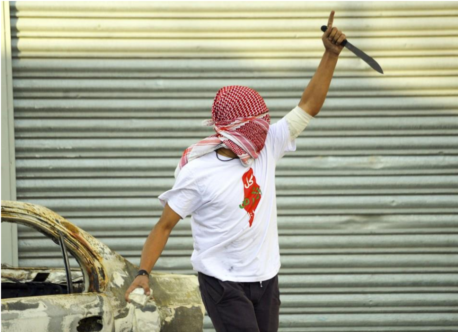
פלסטיני בהפגנה בחברון

אפקטיביות הפעולות. במקביל התקיימו בפיקוד ובאוגדת איז"ש פורומים ללמידה מדי שבוע (פורום מח"טים באוגדה, פורום חשיבה בפיקוד), אשר עסקו בהשגת ההבנות ובניתוח עומק של המגמות המתהוות. החיכוך וההתנסות המתמשכים, יחד עם המשגתם הרציפה, אפשרו לפיקוד לנצח ב"תחרות הלמידה" בינו לבין המפגע הבודד. הפיקוד ויחידותיו המשיכו להשתפר במתן המענה המבצעי לאורך זמן, בעוד קצב השיפור וההשתנות של המפגעים היה נמוך יותר.