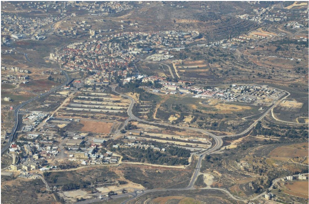
תמונה אווירית של אזור שומרון

הדגשנו את העוצמה הגדולה של תהליך הערכת המצב הנשען על למידה; את החשיבות להגדיר סדרי עדיפויות באמצעות שיעון לחימה משתנה; את משמעות הפיגועים שהתממשו לאחרונה – תופעת ההדבקה גרמה לכך שאחרי פיגוע במרחב מסוים ובמתווה מסוים הסבירות להתממשות פעולה דומה עלתה באופן משמעותי; הגדרת מרחבים מאוימים לפיגועי השראה; הגדרת מרחבים מאוימים בירי; הגדרת מדרג הישובים המאוימים; קביעת מרחבים אלימים ועוד. את כל התהליך הזה בחנו באופן שוטף, למדנו ועדכנו. הבנו שהמפגע בהשראה המייצר אתגר גדול בשורה של תחומים, מייצר גם הזדמנות הנובעת מהגורמים המאפיינים אותו. מפגע בהשראה עושה את הפיגועים מהבטן, ללא תכנון מוקדם, באופן אימפולסיבי, והחשוב ביותר – הוא עושה את הפיגועים "במקומות שבהם עושים פיגועים".