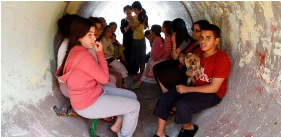
האוכלוסיה הישראלית הסתגלה לשגרת החיים הלא-יציבה

את תושבי תל אביב למקלטים, ובין העובדה שמדובר בגורמים שאין לרצותם ואי אפשר להביסם "אחת ולתמיד" בפעולה צבאית. הצירוף הזה היה מדכא את הציבור בישראל ומאיים על חוסנו, לולא ויתר ממילא על התקווה לפייס את חיזבאללה וחמאס, לולא ידע ישראל מסוגלת להביא בתגובה חורבן על לבנון ולפעול על פי הצורך בסוריה ולפגוע, אם יש בכך צורך, גם באיראן העומדת מאחוריהן. הציבור הזה היה רדוף חרדה מפני פגיעות חמאס, לולא צפה בחורבנה של עזה בשלושה מבצעים גדולים (עם אמפתיה מסוימת כלפי האזרחים האומללים הלכודים בה), לולא בטח ביעילות החומה התת־קרקעית לצמצום איום המנהרות ההתקפיות, ובעיקר לולא נכח בשיתוף הפעולה האסטרטגי בין ישראל למצרים הדוחק את חמאס למבוי סתום. עימותים מכאיבים אומנם צפויים, אך הציבור מניח שמאזן הנוק לישראל מול הסבל לפלסטינים והתועלת ליעדי חמאס נוטה בהתמדה לטובת ישראל.