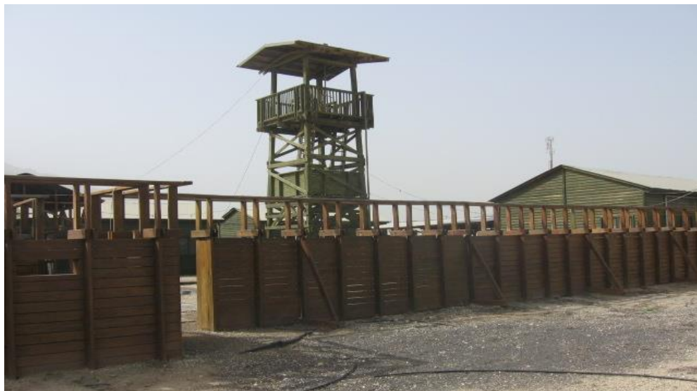
מבנה משוחזר של חומה ומגדל בתל עמל – ניר דוד. תקופה בה יישובי הספר היו חלק מן ההגנה המרחבית

במאבקים מסוג זה יש לרכיב ההתיישבות האזרחי תפקיד חיוני שאינו יכול להתממש על ידי כוח צבאי. טענה זו מתייחסת למתרחש בכלל קווי העימות, לאו דווקא במרחבי ספר כמו יהודה ושומרון, אלא גם במרחבי הגליל והנגב. כוחות הביטחון כשלעצמם לא רק שהם אינם מספקים מסה של נוכחות רצופה, הם גם אינם רגישים דיים לשינויים המתרחשים בשטח והפוגעים באינטרסים הלאומיים הריבוניים. המאבק שהתקיים בגבול סוריה ישראל לפני 1967, מדגים את דוקטרינת הביטחון הישראלית באופן שבו שולבו האזרחים בספר במאמץ הצבאי. במאבק למימוש הריבונות באזורי מריבה בקרבת הגבול התבקשו החקלאים לעבד את השדות בקרבת הגבול עד המטר האחרון, גם בשטח המפורז, למרות הידיעה שהדבר כרוך בתקריות אש שאף יצאו לעיתים משליטה. האם שילוב האזרחים היה מוצדק במבחן המקצועי הצבאי? האם הוא היה ניתן להנמקה במבחן עלות-תועלת כלכלית? למפקדי צה"ל באותם ימים, רב־אלוף דוד אלעזר שנשא בתפקיד מפקד פיקוד הצפון ולרב־אלוף יצחק רבין, הרמטכ"ל, לא היה ספק בצדקת מאבק זה ובחיוניות שילוב האזרחים החקלאים.