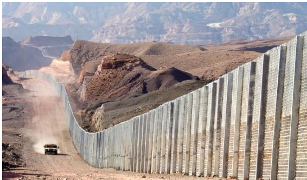
פטרול ליד גדר הגבול בדרום (זיו קורן)

בשנתיים הראשונות לשירותי, טרם מלחמת לבנון הראשונה, נחשב הבטי"ש לרע מגונה. כלומר לפעילות משמימה שיש להמעט בה ככל הניתן, ושהיא מפריעה לצה"ל לעשות את משימתו העיקרית – להתאמן ולהתכונן למלחמה. מעמד הבטי"ש עלה על רקע שנות השהייה הארוכה בלבנון הארוכות וימי האינתיפאדה הראשונה, עת האתגרים גבהו, הלחימה נעשתה שכיחה יותר, והאתגר שניצב בפני הכוחות צמח. גם במציאות מאתגרת זו (מאתגרת יותר בהרבה מהבטי"ש בימינו), עדיין נחשב הבטי"ש משני בחשיבותו עד זזה למלאכת ההתכוננות למלחמה, ומשאבי הזמן חולקו בהתאם – 50 אחוזים לאימונים ו־50 אחוזים לבטי"ש. כדי לשמור על חלוקת זמן זו, גויסו מדי שנה יחידות מילואים רבות, ובלבד שמסכת האימונים וההתכוננות לא תיפגע.