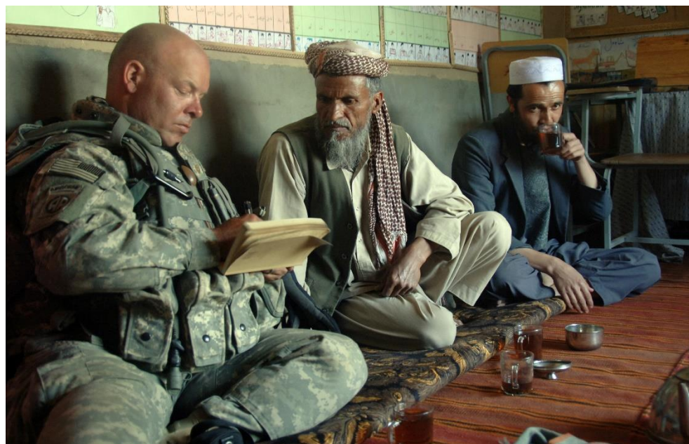
חייל אמריקאי מראיין אזרח אפגני. למידה של התכסית האנושית (USA Defense Department)

מאמצי הלמידה הפכו אותנו ל'טבעיים' יותר במרחב הפעולה. פיתחנו מונחים למפגע היחיד ולחוליה המקומית, התחלנו לזהות תהליכים ובתוכם גורמים מסייעים ומאפשרים בסביבה הקרובה והרחוקה של הטרור בהשאה. מנגד סימנו מגמות מרסנות ומתנגדות לאלימות ובתוך כל אלו סימנו גורמי השפעה מסוגים שונים המאפשרים פעילות אופרטיבית. בניתוח 'תכסית' אנושית עמדנו על בעיות היסוד האזרחיות והמאפיינים הייחודיים של כל כפר, שכונה או מחנה פליטים שערערו באופן בסיסי את המציאות הביטחונית-אזרחית, אך גם היו 'צא כיוון' חשוב בראיית ניצול הזדמנויות.