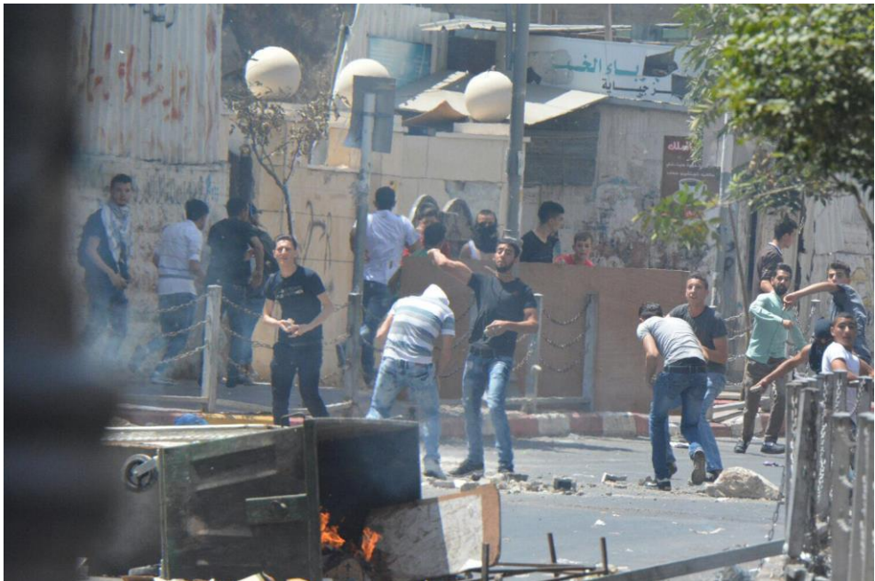
הפרות סדר בשטחי יהודה ושומרון

יישום המדיניות המבדילה והמדויקת בא לידי ביטוי בשורה של תחומים שאפשרו לנו לרכז מאמץ מחד, ולהימנע מהרחבת מעגל השותפים לאלימות מאידך . במרכז היישום חולקה האוגדה למרחבים אלימים ולמרחבים מאוימים באופן שאפשר לנו להתמקד במענה במרחבים אלו באמצעות ריכוז מאמץ, בעוד שבמקומות אחרים התעקשנו לקיים שגרה רגילה.