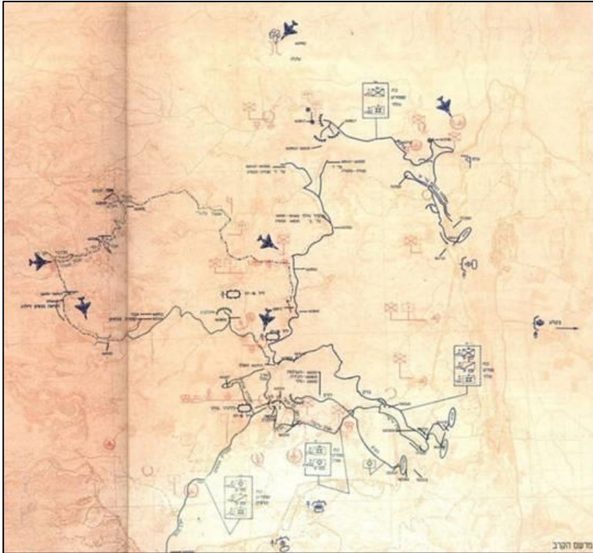
מפה מבצעית של דרום לבנון בזמן מבצע "קלחת 4 מורחבת"

בדיון ההמשך להערכת המצב של אג"ם יוחד חלק מרכזי לדיון אודות הפח"ע. אלעזר פתח והצהיר כי לדעתו לא ניתן ולא צריך לכבוש שטח בלבנון כחלק מן המענה לבעיית פת"ח. כיבוש כזה יסבך אותנו עם המערכת הבינלאומית ובעיקר עם ארה"ב, הוא איננו אפשרי, יגרום לסנקציות כנגדנו וייצור נזק רב. 62