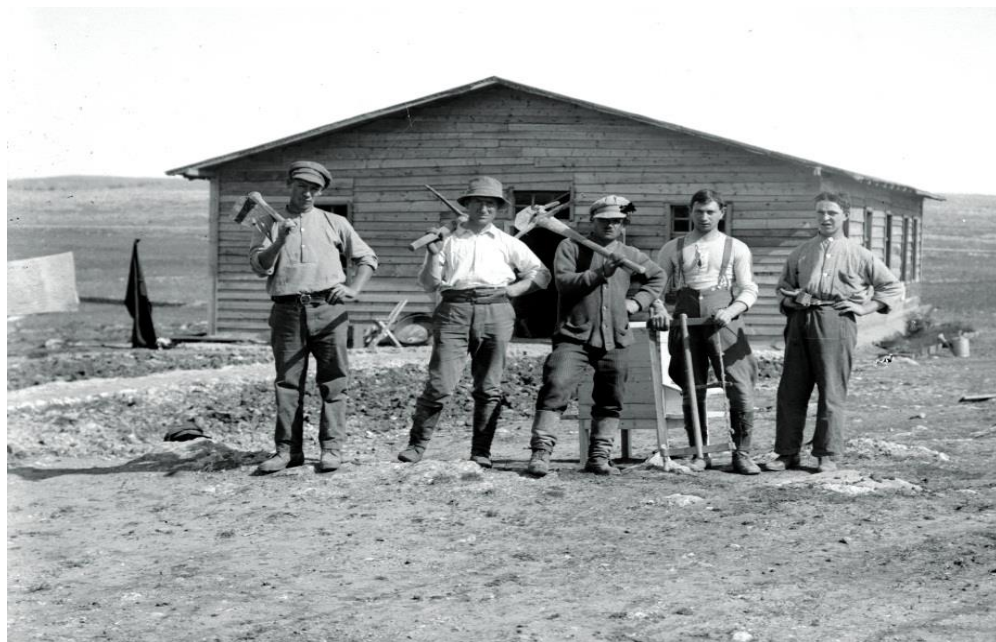
חלוצים ביישוב מגדל בתקופת העלייה השנייה 1912

למטלות הביטחון מתוקף שליחותו החלוצית, נוצרה המגמה להשקעת משאבי עתק בהגנת ההתיישבות בקווי העימות, עד כדי ציפייה להענקת הגנה מושלמת, דוגמת המאמץ לאיתור המנהרות בגבול עזה ולסיכולן.