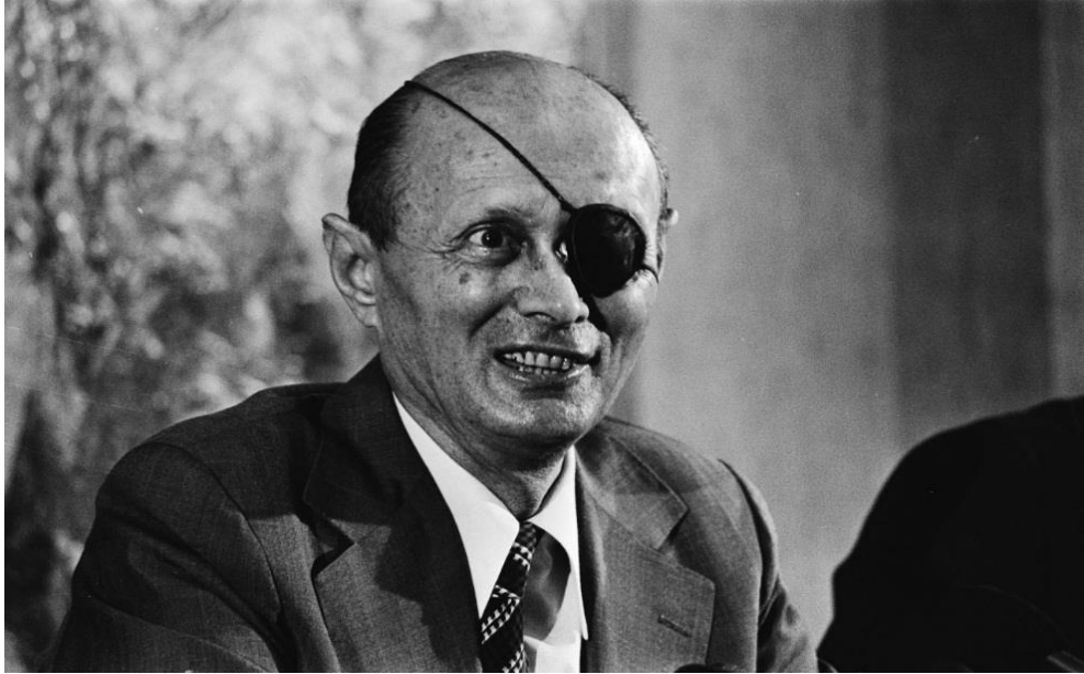
משה דיין בתפקידו כשר ביטחון (ויקיפדיה)