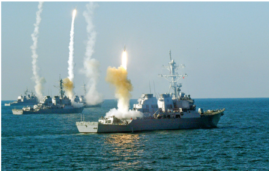
תמונה 2: מהלומה מהתווך הימי 19

מטרותן של המהלומות הרב-ממדיות, כפי שנרמזו בשמן, היא להגדיל את יכולות האש והקטלניות של צה"ל, כאשר המוסכמה היא שהדבר יבוצע באמצעות הרחבת יכולות האש האוויריות. זרוע האוויר הישראלית היא אמנם מכונת תקיפה משומנת, אך לבניין כוח המאפשר מהלומה מהים פוטנציאל תרומה משמעותי. ניתן וצריך לייצר מהים יכולת אש משמעותית ושרידה שתאפשר גמישות הפעלה. האש מהים, שאינה תלויה בהשגת עליונות אווירית, תוכל להיות מופעלת בכל נקודת זמן, ותסייע הן להשגת עליונות אווירית והן להשגת עליונות ימית. מהלומות שמקורן בתווכים שונים, ירוו את מערכי ההגנה של האויב ויתירו פתח לתחבולה. האויב יאלץ להסיט ולחלק את הקשב המבצעי שלו למספר רב יותר של ממדים וכיווני פעולה, ולפזר את כוחותיו . לכשתוקם יכולת זו, היא תאפשר גם להמיר את חלק מתוכניות התקיפה של זרוע האוויר לתקיפה מהים, ובכך תפנה את משאביה היקרים של זרוע האוויר למשימות אחרות. לצורך כך נדרשת מסה קריטית של חימושים והגדלה ניכרת של יכולת התקיפה המדויקת הקיימת היום בזרוע הים. 18