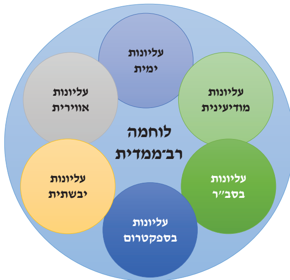
איור 2: העליונות הימית היא מרכיב הכרחי בלוחמה הרב־ממדית

והיסוד האסטרטגי הצבאי הבלעדי של ישראל... הם יכול להוות עומק אסטרטגי - אם קיים צי מלחמה המנצל את מרחביו ומעמקיו. על חיל הים של ישראל להפוך את הים לחלק מהעומק הביטחוני שלה". 29 כיום, העומק האסטרטגי הימי בא לידי ביטוי בהפקת גז בשטחי המים הכלכליים, אך בעתיד עשוי העומק הימי להכיל תשתיות לאומיות נוספות: איים מלאכותיים, שדות תעופה בים, חקלאות ימית ועוד. הים לא יהווה עומק אסטרטגי רק בהיבטים הגנתיים, אלא גם בסיס שהייה לפלטפורמות שרידות בעלות יכולות פעולה התקפיות מגוונות. טרנספורמציה בזרוע הים תהפוך אותה למרכיב משמעותי והכרחי בלוחמה הרב־ממדית. "אם ישראל חפצה חיים, עליה להזדרז ולפתח את חיל הים כזרוע אסטרטגית. כשנסגרת היבשה, חייבים לפתח גיבוי מהים". 30