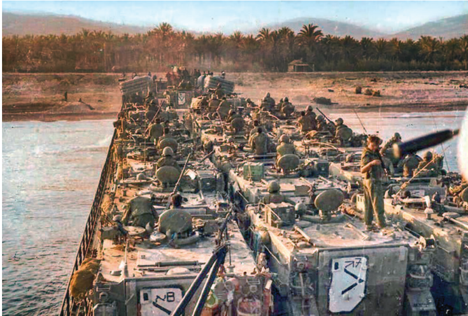
תמונה 3 - זרוע הים במלחמת לבנון הראשונה 26

תמרון רב-זרועי ולא תמרון נבדל של צבא היבשה: "התמרון היבשתי הוא רב-זרועי ורב-תחומי במהותו - לא ניתן להילחם ללא חיל האוויר; לא ניתן לפעול בעומק ללא חיל הים". 25