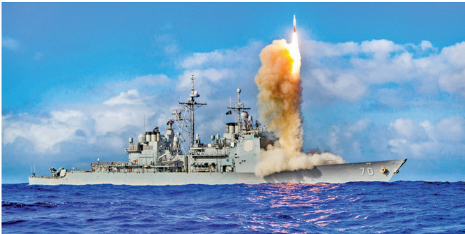
תמונה 1: הגנה מטילים בליסטיים - Aegis BMD 17

ספינות הטיילים של הזרוע ייקחו חלק משמעותי בהגנה על שטח המערבי של ישראל. סוללות ההגנ"א הניידות בים אינן מוגבלות רק לשטח המים הכלכליים. ניתן יהיה, בהתאם לצרכים המבצעיים, לפרוס אותן בים בכל נקודה שתידרש. בניגוד לסוללות הגנ"א יבשתיות, שהינן נייחות ופריסתן מוגבלת לשטח ישראל, ספינות המגן יהוו סוללת הגנ"א ניידת ושרידה שניתן לפרוס הן בשטח המים הכלכליים של ישראל והן בעומק שטח האויב. פריסה קדמית של הסטי"לים בים הינה בעלת פוטנציאל להרחקת הלחימה מהעורף הישראלי. בכך תוסיף זרוע הים לשלוש שכבות ההגנה הקיימות של מערך ההגנ"א - השכבה התחתונה, שכבת הביניים והשכבה העליונה - גם מרכיב של שכבת הגנה קדמית . הקישוריות עם מערך ההגנ"א היבשתי של חה"א תוכל לספק התרעה מוקדמת ולהפוך את מאמץ ההגנה לקרב הגנה משותף ורב-ממדי. הצי האמריקאי אימץ רעיונות דומים וזים את מערכת ההגנה מפני טילים Aegis - הקרויה על שם המגן של זאוס, אל במיתולוגיה היוונית. המערכת מבצעת ביותר מ-100 ספינות של חצי תריסר ציים בעולם 16 (תמונה 1).