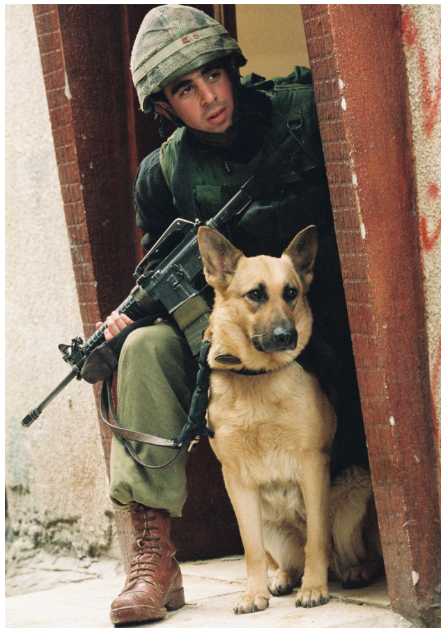
לוחם צה"ל מיחידת הכלבנים וכלבו, בפעילות מבצעית בטול כרם, 3 באפריל 2002.

אך עיקר הכוח של צה"ל התכונן לשני המבצעים הגדולים בעיר שכם ובמרחב העיר ג'נין. לפעולה בשכם, שנחשבה לבירת הטרור, נשלחו שתי החטיבות הסדירות, גולני והצנחנים, עם חטיבת שריון במילואים (חטיבת יפתח) ועם כוחות קטנים נוספים, כמו יחידת מגלן, סילוק פצצות וכוחות חילוץ והצלה מפיקוד העורף. ג'נין ומחנה הפליטים הצמוד היה ביתם של ארגוני טרור קיצוניים מאז המרד הערבי הגדול (1936-1939). למשימה במרחב הוקצו שתי חטיבות מילואים, חטיבת השריון 656 לעיר וחטיבה 5 מתוגברת בגדוד 51 מגולני, צוותים משייטת 13 וכוחות שריון והנדסה ולמחנה הפליטים.