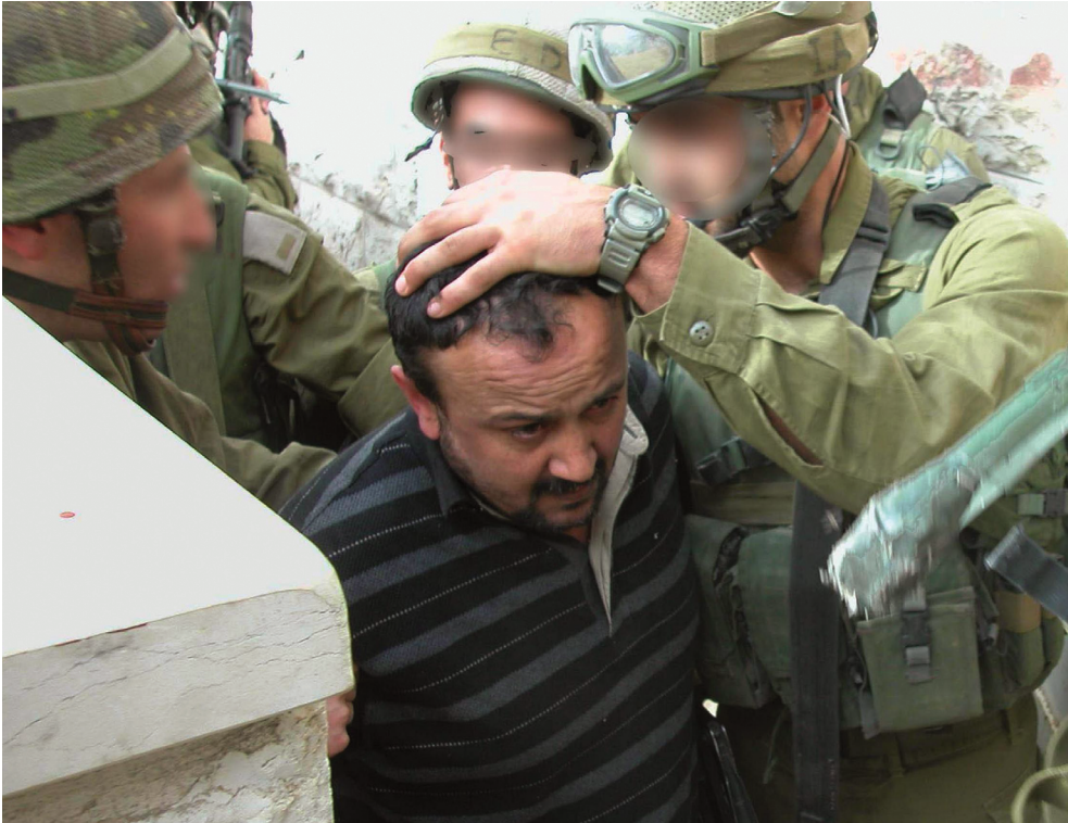
חיילי צה"ל לוכדים ברמאללה את ראש "התנזים" מרואן ברגותי, החשוד ברצח ומעשי טרור בישראל, במהלך מבצע "חומת מגן", 16 באפריל 2002.