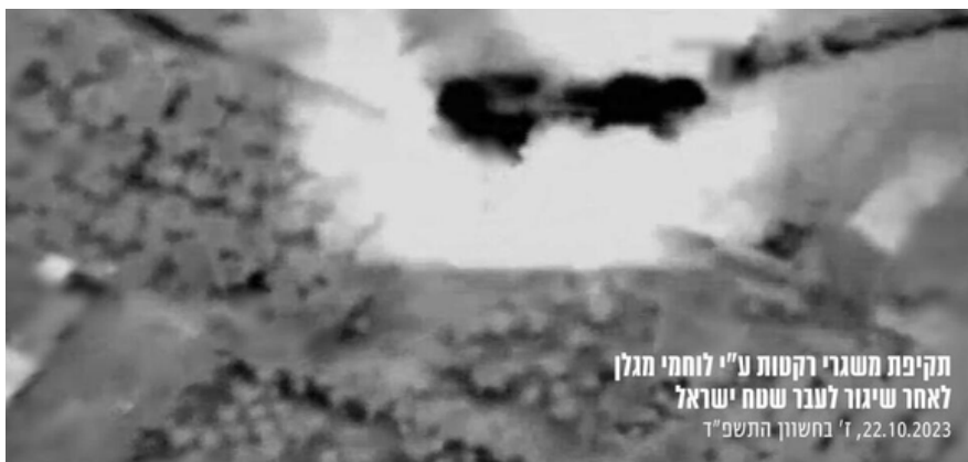
תקיפת משגרי רקטות ע"י לוחמי מגלן לאחר שיגור לעבר שטח ישראל 22.10.2023, 1' בחשוון התשפ"ד