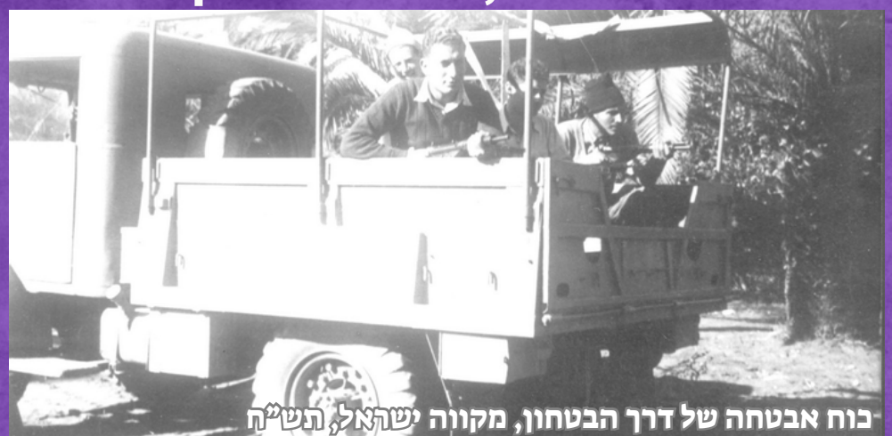
כוח אבטחה של דרך הביטחון, מקווה ישראלי, הש"ח

בזכות פעולות האבטחה של חטיבת גבעתי בתקופה זו יכלו שיירות האספקה להגיע לירושלים ולנגב הנצורים, הודות למאמצי הלוחמים וגבורתם, הובטחה הדרך.