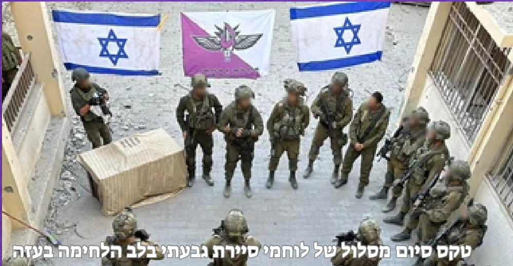
טקס סיום מסלול של לוחמי סיירת גבעתי בלב הלחימה בעזה