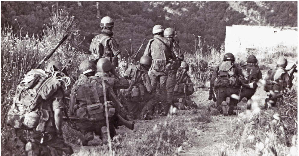
לוחמי נח"ל מוצנח במרדף אחר מחבלים בעיירה דיר אל-קמאר, יולי 1982

צה"ל בנתיבים שבהם הוערך שהמחבלים נעים, היה המארב מתקיל את המחבלים מטווח קצר ומסתער עליהם. בשיטה זו נהגו גם המחבלים והיו מניחים מארבים לכוחות צה"ל בנתיבים היוצאים מהמוצבים, גם בגזרה המזרחית וגם בגזרות אחרות. 64 תצפיותיהם היו מאתרות כוחות צה"ל הנעים בשטחים שמחוץ למוצבים, ובצירים הן היו מכוונות אש ארטילרית ותול"רים לעבר כוחותיו. במקרה זה סייעו גם, ככל הנראה, הסורים, וכאשר תצפיותיהם גילו כוחות צה"ל הם היו מעבירים את המידע למחבלים, ואלה היו משתמשים בו לצורכיהם. לאחר שנורתה אש לעבר מארב שנתגלה ב־20 ביולי באזור מנצורה, ב־21 ביולי יצא כוח לסריקות באזור, ולעברו נפתחה אש. ממנה נהרגו חמישה חיילי צה"ל, וחייל נוסף נפצע. 65