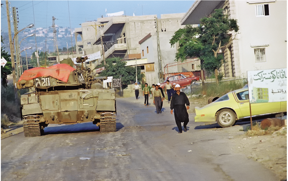
מלחמת שלום הגליל לאחר שוך הקרבות. טנק מפקד חטיבה 844 בתנועה מזרחה לעבר הר הלבנון והבקאע.

והתייצבותם של כוחות חטיבה 35 וחטיבה 828, שביצעה איגוף מזרחי דרך אוגדה 162, על ציר ביירות-דמשק ממזרח לעיר הביאו להשלמת הכיתור ולתחילת המצור על העיר ביירות.