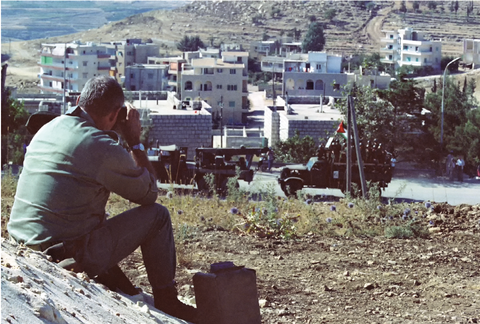
מפקד פיקוד הצפון, אמיר דרורי, צופה בנסיגת המחבלים.

את המחבלים לשטחן וכי מחבלים שירצו יוכלו להניח את נשקם ולזכות ליחס הוגן מצד ישראל. לכוחות הסוריים בביירות הועבר מסר שמדינתם זנחה אותם. באמצעותו ניסו למנוע מהם להשתתף בלחימה העתידה להתרחש לפי תוכנית 'אחדות לוחמים' ולהביא לנסיגתם מזרחה כדי שלא יחברו לכוחות הסוריים בגזרה המזרחית. לפי הערכות המודיעין, בביירות היו כ־7,000 מחבלים 92 וכ־6,000 חיילים סורים.