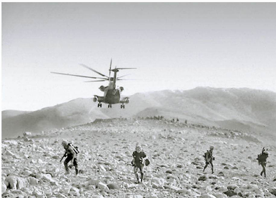
מסוק יסעור ממריא לאחר שהנחית צנחנים וציוד על רכס החרמון, 22 באוקטובר 1973 5

ברכס בטרם המלחמה). מוצב הפיתולים ומוצב החרמון הסורי, יעדי "עוצבת הנשר", היו בגובה של כ-2,500 מטרים. בשטח היה ערוך גדוד קומנדו סורי, וגדוד קומנדו נוסף וכוח שריון היו ערוכים כתגבורת בערנה שבמורדות החרמון בצד הסורי. על כוחות החטיבה הוטל לטהר את מרחב הפעולה ולכבוש שני יעדים מבוצרים שבהם ערוך כוח מאומן וחמוש היטב (גבעתי, 2015, עמ' 290).