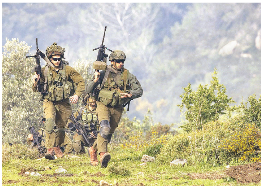
כוח מגדוד בחטיבת צנחנים מילואים 226 באימון

שנית ראוי לציין כי המלחמה, כשפרצה, התרחשה הרחק ממרכזי האוכלוסייה. איש מילואים שגויס יכול היה לצאת לקרב "בראש שקט" מתוך ביטחון שהוא, פשוטו כמשמעו, יוצא להגן על ביתו ולהרחיק ממנו את מוראות המלחמה ולא עם חשש שהוא "מפקיר" את הגזרה הביתית.