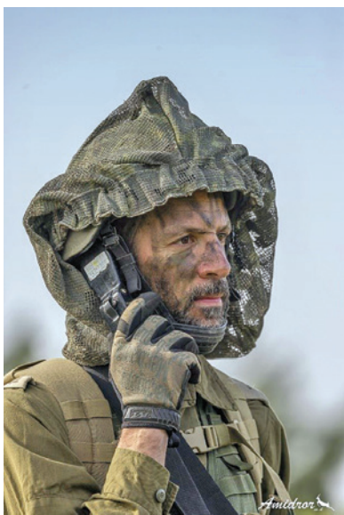
מפקד בחטיבת צנחנים מילואים 226 באימון

תהליך במילואים אורך זמן ממושך). עם זאת נוכח האיום אין מדובר ב"תרופת פלא". נדרשת תחזוקה מתמדת לשימור כושרן הקרבי של יחידות המילואים. המיקוד במשימה ספציפית חיוני ליכולתה של יחידת מילואים להיערך אליה בהתאם ולבנות כשירות מקצועית יחידתית. מיקוד זה יחזק בקרב היחידה ואנשיה את תחושת המסוגלות ואת האמון כי אין מתאמנים לקראת תרחיש עמום אלא לקראת משימות ברורות שהסבירות שיידרשו להן ביום פקודה גבוהה. האימון למשימות אלו, בדומה למה שנעשה בשעתו באימוני "רף פצ"ן", חייב להיות בשטח ובתרחיש מדמים ככל הניתן. אימון שאינו נכון ושאינו מקצועי, בשטח שאינו תואם את מתאר הלחימה הצפוי לכוחות, רק יגדיל את הפערים המקצועיים ויפגע ביכולתם של הכוחות לפעול בצורה מיטבית בשדה הקרב.