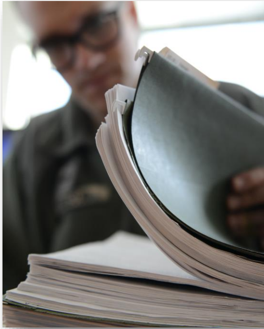
חופש המידע - אילוסטרציה

גם תוכן הסייגים עורר התנגדויות. אחד הקשיים בנוסח הראשון של הצעת החוק נגע לסוגיית "ההשמטות". בהצעה הוצע לקבוע כי כאשר הרשות יכולה למסור מידע אך ורק תוך השמטת פרטים מסוימים (מסיבות ביטחוניות) – עליה למסור את המידע תוך ציון העובדה שנעשו השמטות.