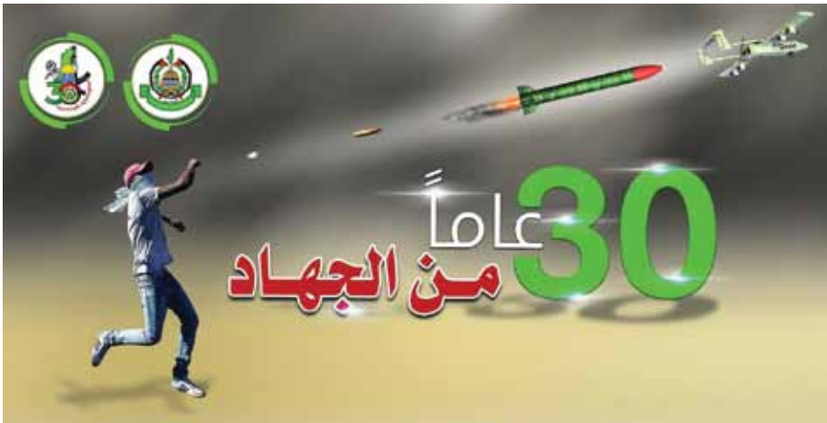
תמונה 6: מפת הדרכים הטכנולוגית של חמאס

בקיץ האחרון "המציא" החמאס נשק חדש, המבוסס על מוצר מדף, בדמות עפיפונים, בלונים ורחפנים עם מנגנוני נפץ המבוססים גם הם על מוצרי מדף זמינים וזולים, ומימש אותם תוך שבועות ספורים. מגמה זו של החמאס ניכרת גם מתוך כרזה שפרסם השנה במלאת 30 שנה, ובה הוא מציג את "מפת הדרכים הטכנולוגית" שלו, המבוססת בקצה