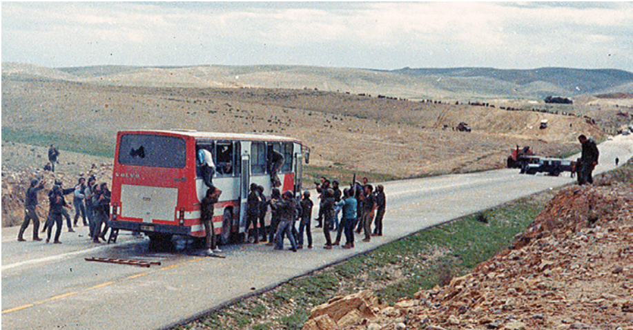
תמונה 1: רגע פריצת לוחמי הימ"מ ל'אוטובוס האמהות'. חטיפת האוטובוס היא דוגמה אחת מני רבות לאירועי בט"ש שאירעו בגזרה הדרומית בסוף שנות ה-80 ובתחילת שנות ה-90 של המאה הקודמת

באחד מסיכומי האירועים קבע אלוף מתן וילנאי, מפקד פיקוד הדרום: "אירוע בט"ש שלא הסתיים תוך עשר דקות הוא כישלון". אפשר שאלוף וילנאי הגזים מעט בדבריו, וניתן להצביע על לא מעט אירועים שנמשכו יותר מעשר דקות ושהסתיימו בהצלחה. אך כוונת הדברים הייתה ברורה ונותרה רלוונטית: כוח צבאי במשימות הגנה, בכל סוגי העימותים, צריך לפעול תמיד במהירות. הדברים אמורים במיוחד באירוע שבו צריכים לפעול הכוחות המופקדים על הגנת הגבולות (בט"ש). אירוע זה חייב להסתיים מוקדם ככל האפשר. אם לא כן, כל רגע שעובר מגדיל את הסכנה ומחייב נקיטת פעולות מורכבות שבהן מעורבים כוחות רבים יותר. לדוגמה, חוליית מחבלים שתנסה לחדור דרך הגדר במטרה לבצע פיגוע הרג ביישוב; אם תתגלה החולייה בזמן, ניתן יהיה לנטרלה אפילו בלי להשמידה. אך איחור של דקות ספורות - הזמן הנדרש לעבור את המרחק בין הגדר ובין בתי היישוב - יחייב הזעקת כוחות רבים, מפקדות, כוחות הצלה ועוד. אזרחים הרוגים ביישובי השומרון, כמו לא מעט מחבלים שנטרלו על גדרות היישובים או בשביליהם, הם ההוכחה האילמת (הכואבת לגבי הראשונים, והיעילה לגבי האחרונים) לצורך בסיום מהיר של כל אירוע בט"ש.