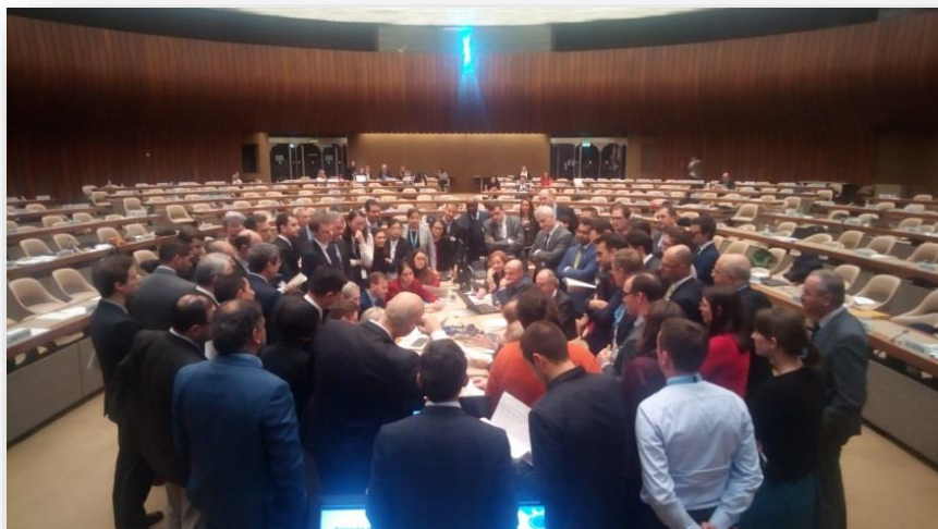
תמונה ממפגש שנתי של המדינות החברות באמנת ה-CCW, נובמבר 2018