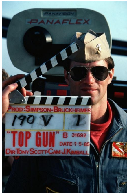
תמונה מצילומי הסרט "TOP GUN"

חמש עשרה שנים מאוחר יותר בסרט "בלאק הוק דאון" 3 המבוסס על קרב שהתרחש בשנת 1993 במוגדישו, בירת סומליה, בין כוחות צבא אמריקאים לבין מיליציות סומליות, הפעלת הכוח האווירי רחוקה מרחק שמים מארץ המתואר ב-TOP GUN. הפעילות בקרב היא לא של טייס בודד אלא של כוח אווירי המהווה חלק מצוות לוחם רחב יותר המונה לוחמי קומנדו ולוחמים על הקרקע הפועלים כנגד גורמים א-מדינתיים בתווך אזרחי עוין.