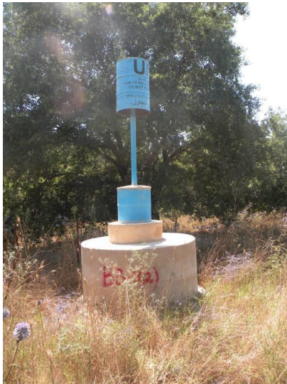
תמונה מספר 7 - חבית המסמנת את הקו הכחול