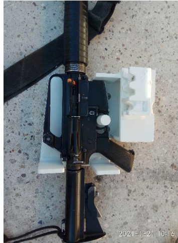
תמונה 3 : הכנסת הנשק האישי להתקן

(5) סגור את הנשק, המותקן בתוך ההתקן בעזרת המכסה, אחוז את המכסה בעזרת הידית ותוך כדי הכנס את ראש המנעול למקומו. לחץ על ראש המנעול במקומו ובעזרת היד השנייה (היד שהחזיקה את המכסה) הכנס את סגיר המנעול למקומו ונעל את המנעול (ניתן להיעזר באדם נוסף לביצוע הנעילה), כפי המוגדר בתמונה 4 :