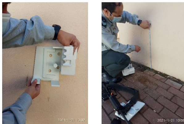
תמונה 2: מיקום בסיס ההתקן ע"ג קיר

הערה: טרם בחירת מקום להתקנת ההתקן ע"ג הקיר, נדרש לוודא שלא עובר באזור חוטי חשמל או צינור מים